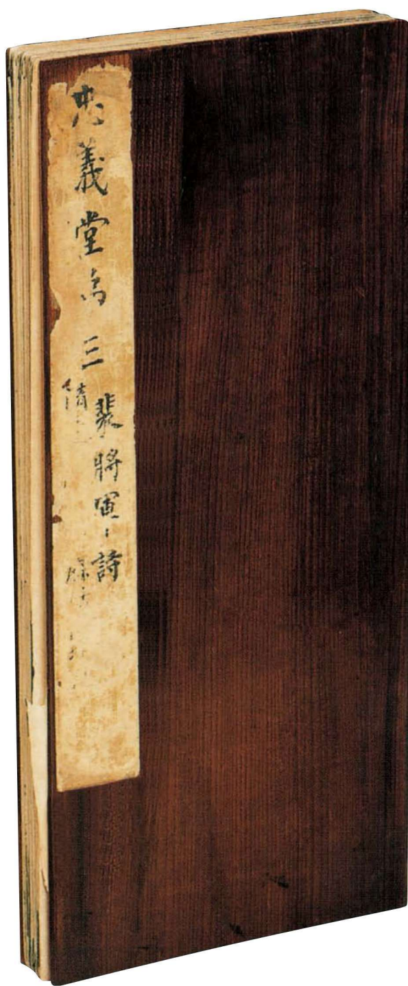
宋拓《忠義堂帖》刻本 第三册