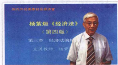
▲北京大学杨紫烜教授