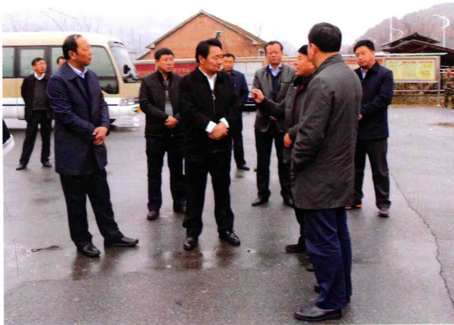
副市长刘国秀到村探访