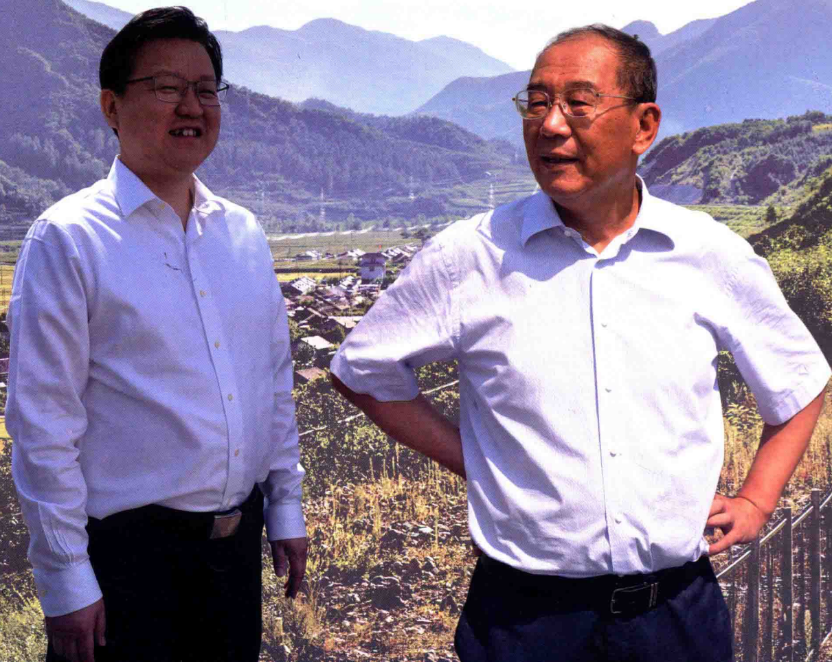
图为市委书记江瑞、市长高宏彬在湾湾川村。

湾湾川村的发展，离不开省、市、县、乡各级党委和政府的领导坚定支持。每到一个历史关键时期，各级领导都能亲自到村、到现场指导检查工作，指明今后工作方向。副省长赵化明、市委书记江瑞、市长高宏彬和其他领导都来湾湾川指导工作，给村干部群众巨大鼓舞。