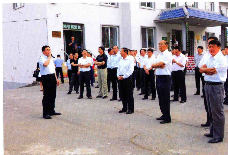
市委书记江瑞、市长高宏彬、副市长刘国秀等领导多次带领各级组织来湾湾川村考察指导工作