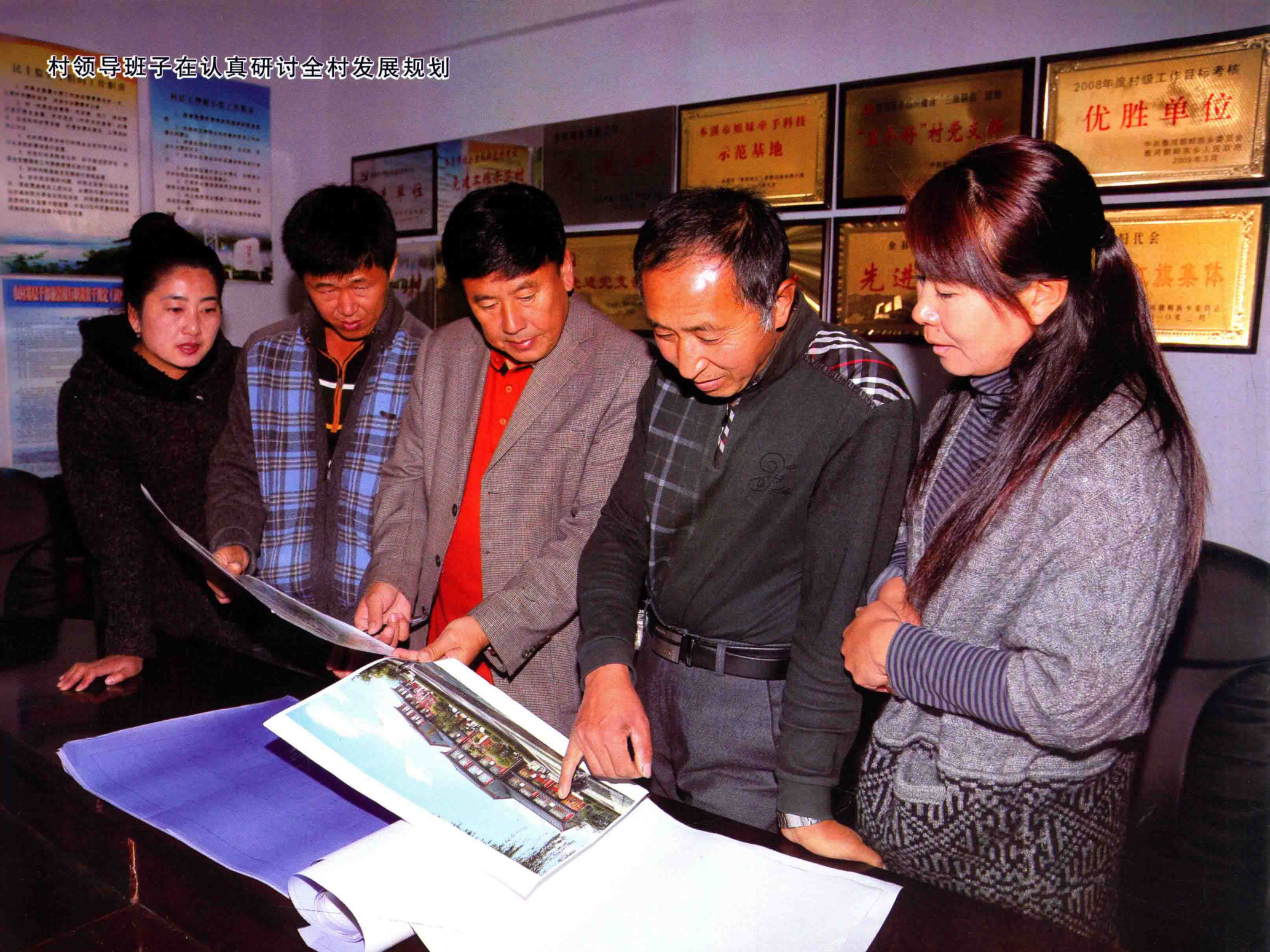
村领导班子在认真研讨全村发展规划