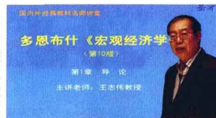
北京大学王志伟教授