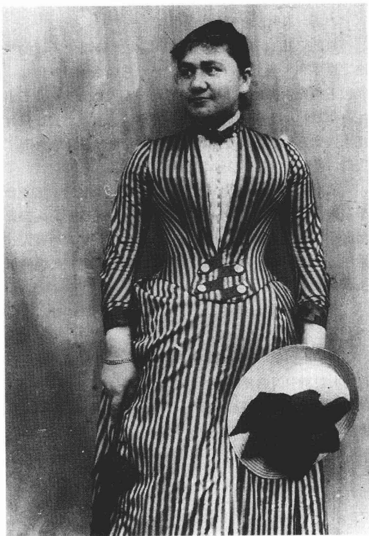
爱因斯坦的母亲：泡琳