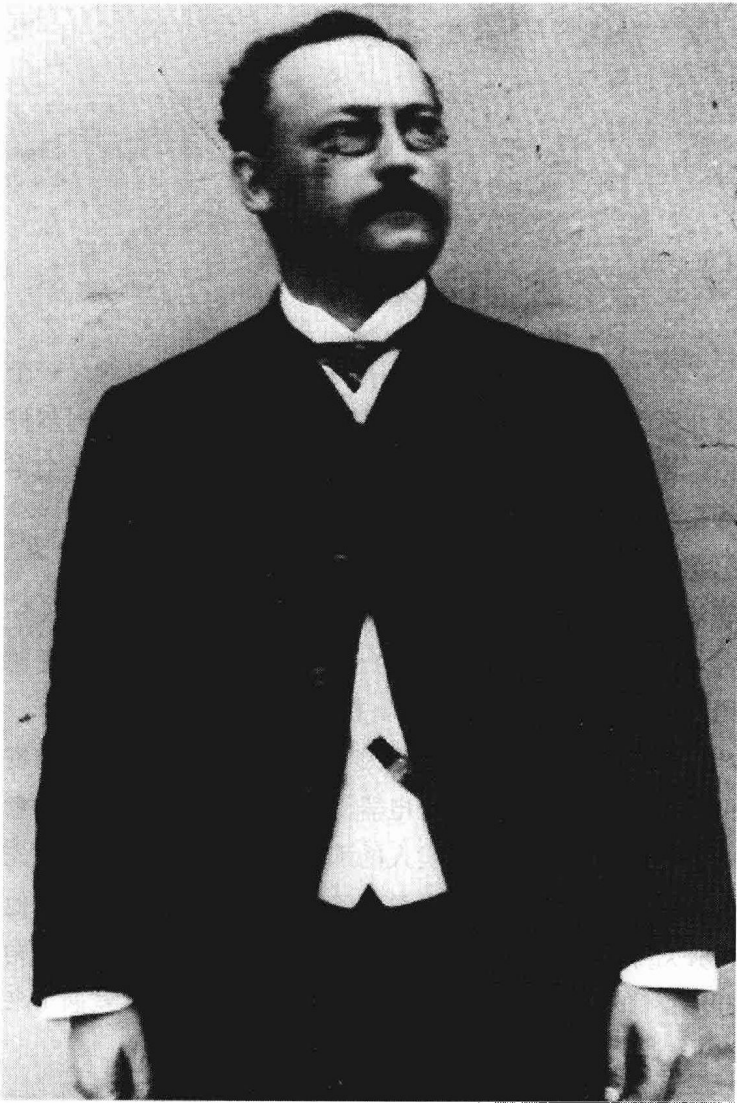
爱因斯坦的父亲：海尔曼·爱因斯坦