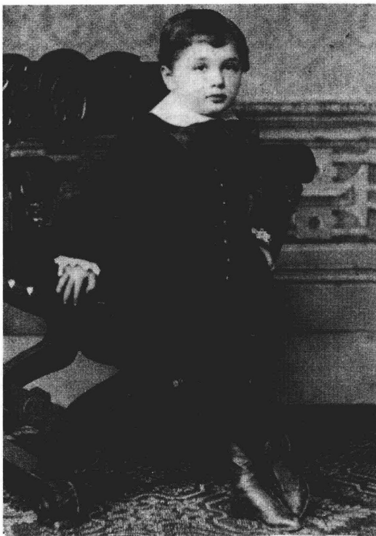
爱因斯坦4岁时的照片