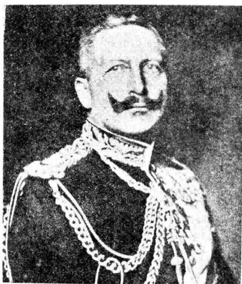
威廉第二 (Wilhelm II.)