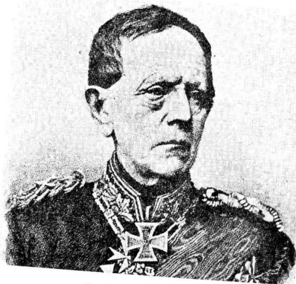
毛 奇 (Moltke)