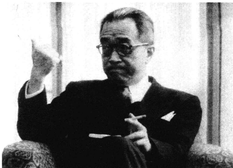
上：1951年胡适（右）与时任哥伦比亚大学校长的艾森豪威尔（中）等合影。