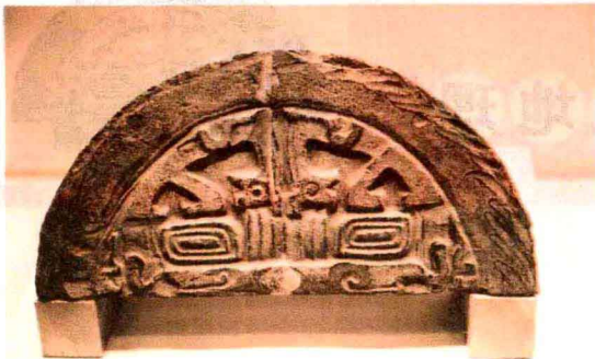
战国时期燕国的兽面纹半瓦当

纣,封召公于北燕。”这里所说的北燕就是燕国。由此看来,在西周初年的时候,现在的北京城及其临近的地区,实际上有两个西周的诸侯国,一个是蓟国,另一个是在蓟国附近建立的燕国。