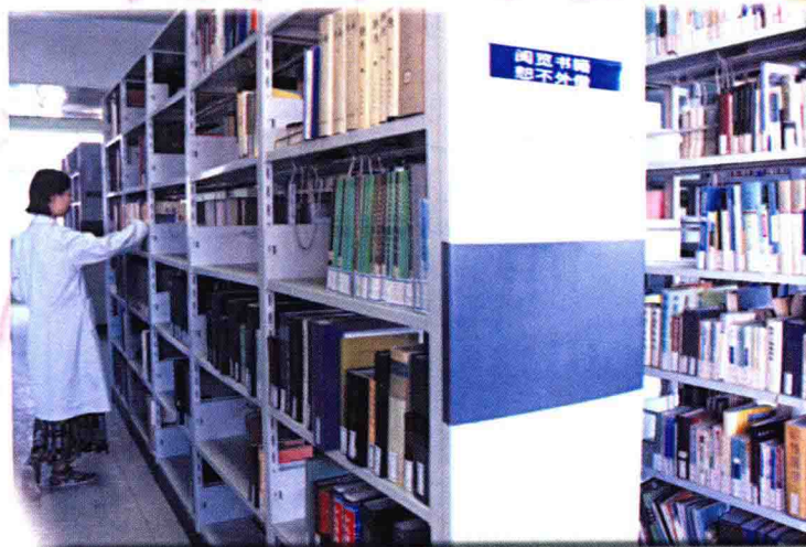
图书馆藏书 27040 册，期刊 11605 册。