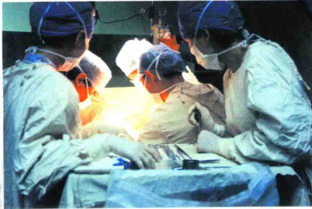
法乐氏四联症手术