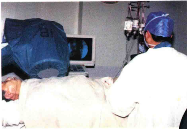
急性心肌梗塞冠状动脉溶栓术