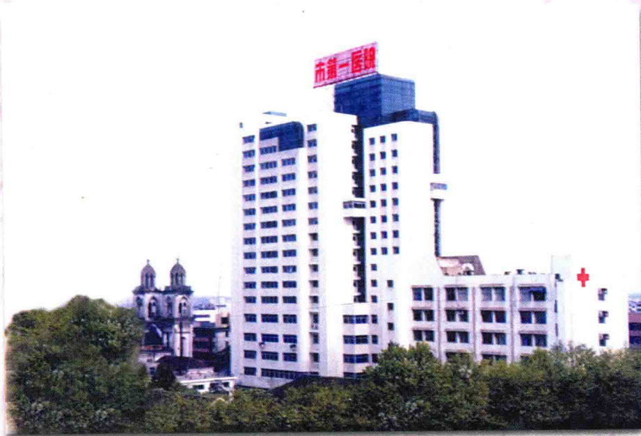
1997年投入使用的医院住院大楼。