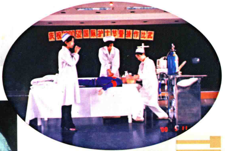
庆祝“5.12”护士节心肺复苏技能表演