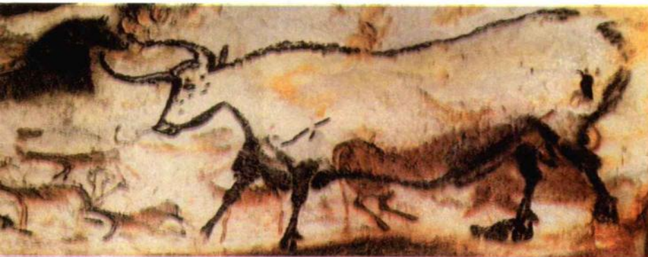
拉斯科山洞岩画（局部）距今约 2.5 万年

这幅洞窟壁画发现于西班牙的阿尔塔米拉山洞，它是保存着史前绘画的一个最著名的洞窟，又是西班牙北部海岸地区史前艺术的荟萃之地。《野牛图》是其中不多的几个精彩作品之一，也是整个洞窟中保存最好的形象之一。这些野牛的形象都分布在洞窟的顶部，而且在深达 300 多米的大洞穴中，没有照明根本无法观察。绘制这些野牛的颜料是用动物的脂肪和血调和的，色彩为赭色略泛红，在靠近轮廓线部位用黑色擦出立体感，轮廓线用的线刻又浅又淡，很有表现力，令观者不得不惊叹原始艺术所焕发出的隽永魅力和美感。