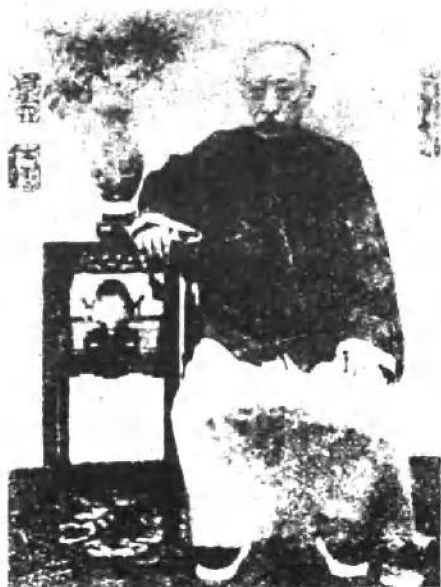
恭亲王奕訢便服像