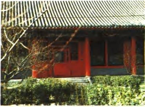
恭亲王府葆光室 王府西路中进院落正厅