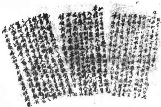
奕訢给七弟奕 讓的亲笔信