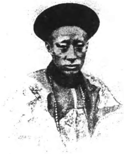
恭亲王奕訢青年正面像