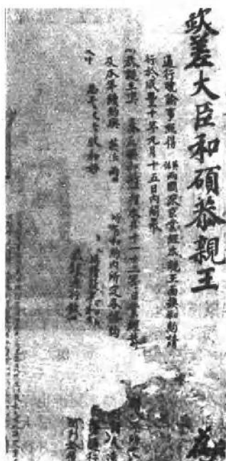
以「欽差大臣和碩恭 親王」名义发表的布告