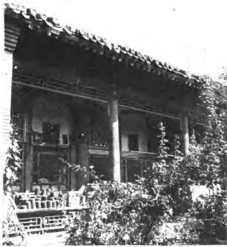
奕訢别墅朗润园一角之今貌 该园今为北京大学家属区之一