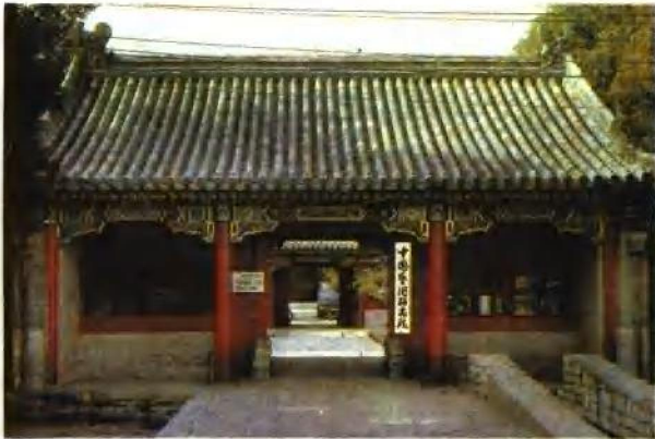
恭亲王府正门 原为三开间大门，两侧各有旁门三间，大门前有石狮一对。王府今改为中国艺术研究院，只留中门。