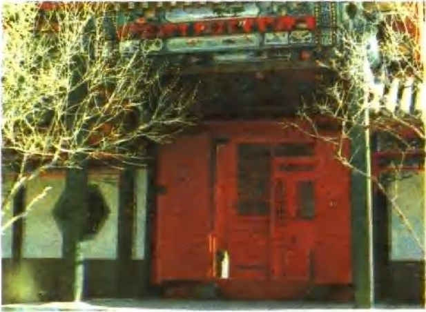
恭亲王府天香庭院 为王府西路葆光室与 锡晋斋两院落间的过门