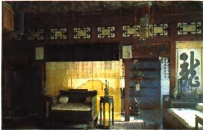
养心殿东暖阁 奕訢与太后议政处