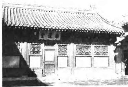
乐道堂 紫禁城西 六官之一配殿，似为奕 沂诞生地