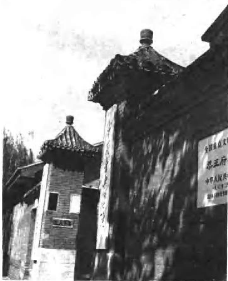
恭亲王府外门今貌（此门系日后所建）现将全部恭亲王府列为全国重点文物保护单位