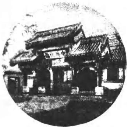
总理衙门正门 门额为“中外裨福”