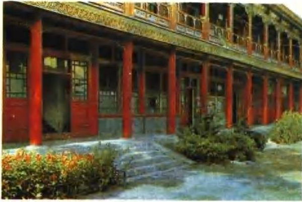
恭亲王府后罩楼 该楼前承恭王府内东、中、西三路建筑，后接王府花园，为160余米长，凹字形二层木结构建筑，约有室百余间，俗称此楼为“九十九间半”。