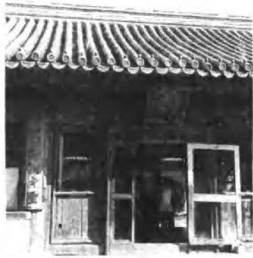
体元殿 乐道堂院内正殿， 慈禧太后与恭亲王联合当政时重 修，殿门楹联为：「自强不息以 希天，逊志好学以希圣」