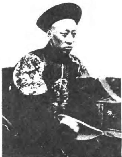
恭亲王奕訢青年侧面像