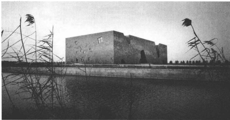
图1 溧阳新四军 江南指挥部纪念馆

史。这是一种特殊的历史。它以其切近性和鲜活特征，将自身与中性的大历史分离开，成为一个独立的、有着绝对价值的领域。支撑着它的自然就是其“崇高客体”（新四军将士），所以它有一个广为人知的称呼“铁军”。