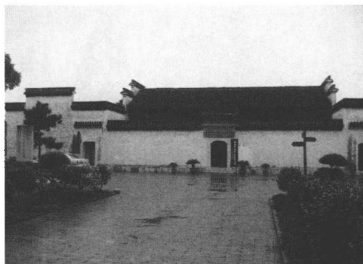
图3 浙江省长兴县新四军苏浙军区纪念馆