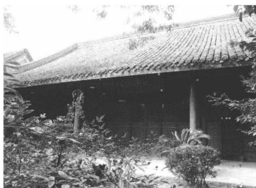
图4 泰州新四军东进泰州谈判纪念馆