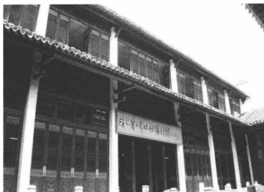
图2 安徽泾县新四军军部旧址陈列馆