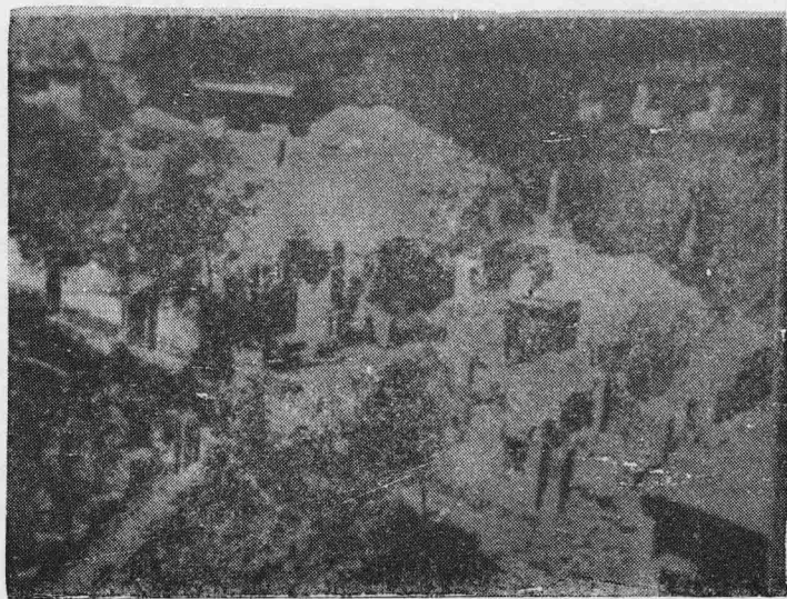
一九三八年日寇进攻襄垣时，将宝峰寺焚之一炬。图为焚烧后的残迹。