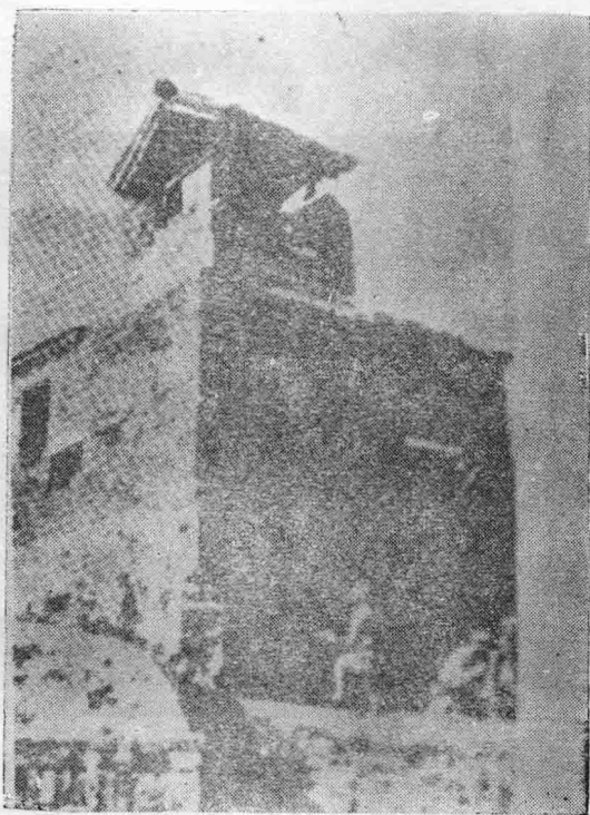
图为日寇侵占襄垣时期在东南城墙上修的角楼， 解放襄垣时被我军摧毁。