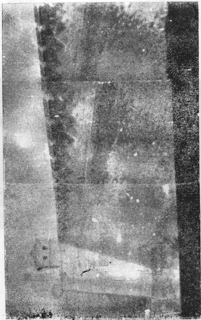
图为一九三八年日寇侵占襄垣后，强迫人民修复的城墙之一角。