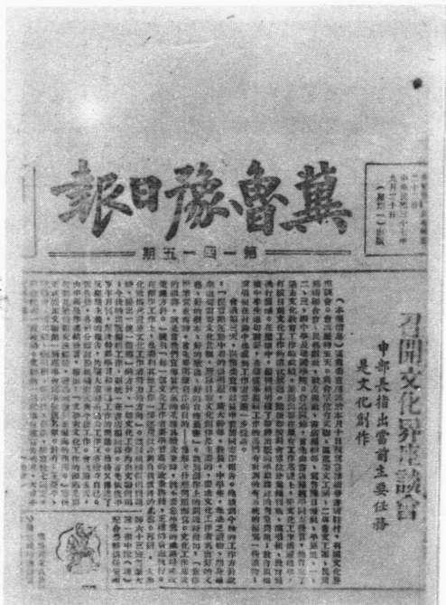
冀鲁豫解放区创办的报纸