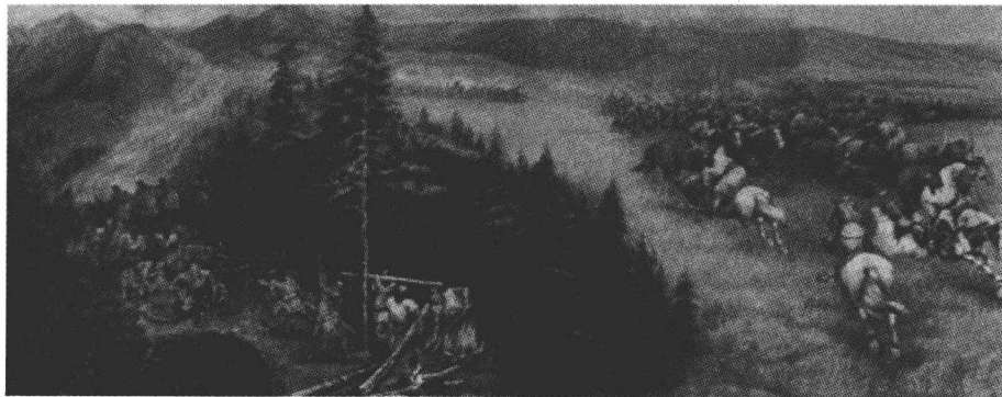
当时分散的蒙古各部长期互相征战，由金朝分而治之