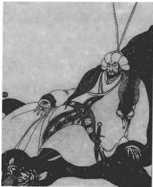
完颜阿骨打，金王朝的创立者

那牙勤（Noyagin），相传是那牙吉歹（Noyagidai）之后，一说为杞黑速（Jqsu）之后。