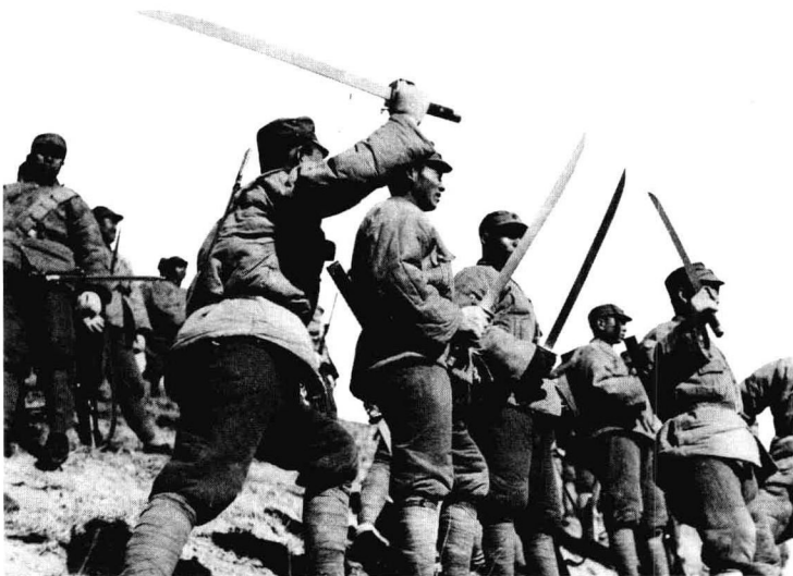
↑ 为了获得中国东北部满洲里资源丰富的地区，日本于1931年占领了奉天城（沈阳的旧称）。

1931年9月18日晚，盘踞在中国东北的日本关东军按照精心策划的阴谋，将沈阳附近柳条湖一带南满铁路路轨炸毁，并嫁祸于中国军队，诬称是中国军队所为，日军以此为借口，突然向驻守在沈阳北大营的中国军队发动进攻，这就是所谓的“柳条湖事件”。据这一事件的具体执行者、日本关东军参谋花谷正后来回忆道：“9月18日夜，岛本大队川岛中队的河本末守中尉，以巡视铁路为名，率领部下数人，向柳条湖方向走去，一边从侧面观察北大营兵营，一边选了个距北大营约800米的地点，在那里，河本亲自把骑兵用的小型炸药装置放在铁轨旁，并亲自点火，时间是夜晚10点钟刚过，轰然一声爆炸，炸断的铁轨和枕木向四处飞散……”