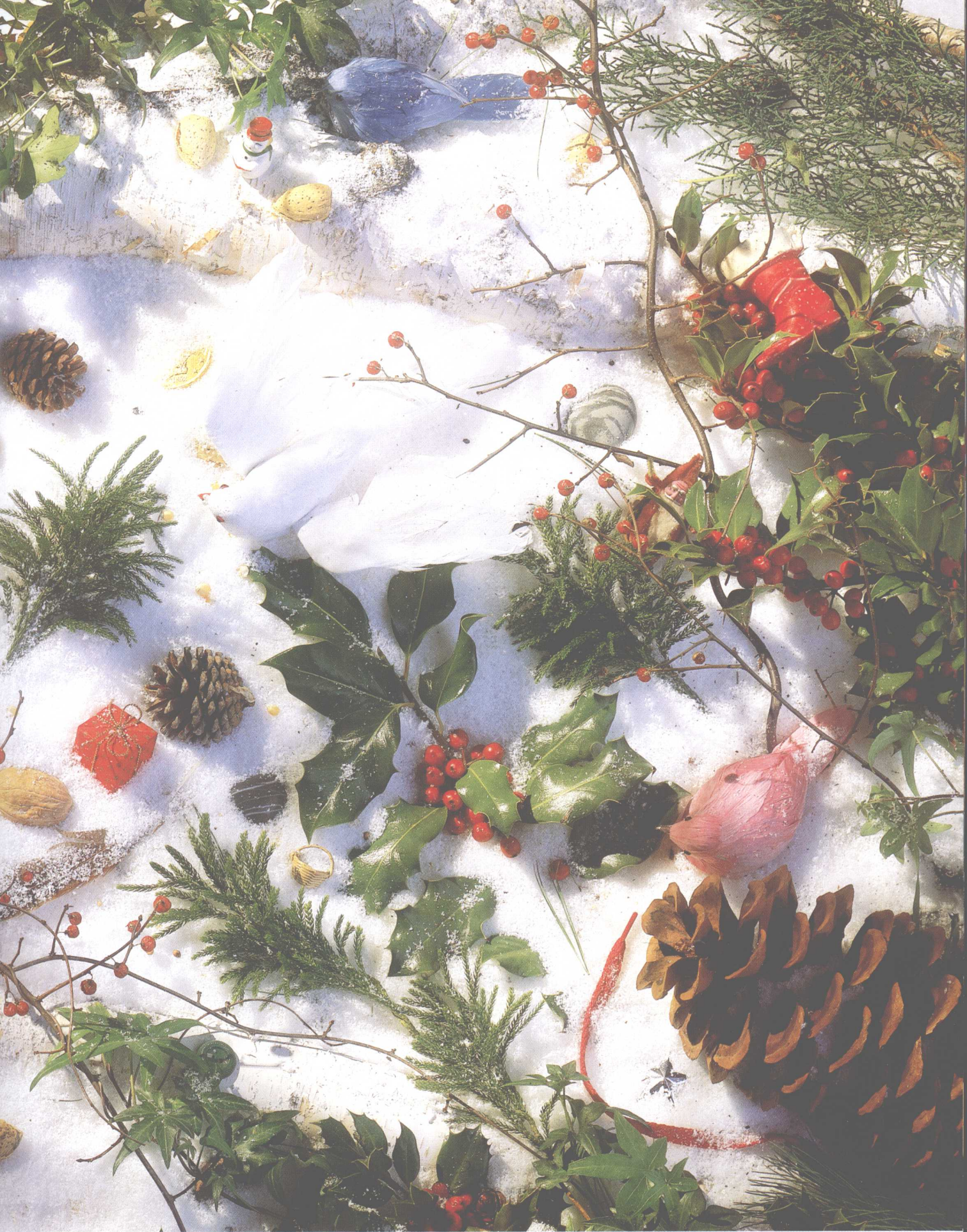
红色鞋带儿，老式的钥匙， 七颗松果，两块条纹石。