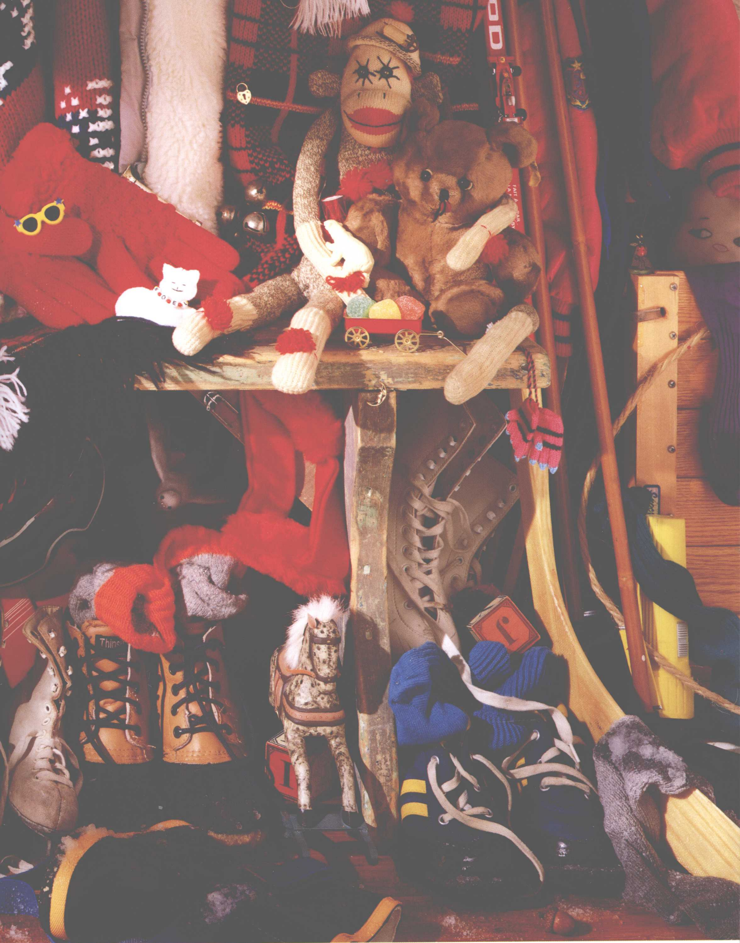
两只斑鸠很好找，三双五指的手套， 袜子做成的小猴，两只沾雪的手套。