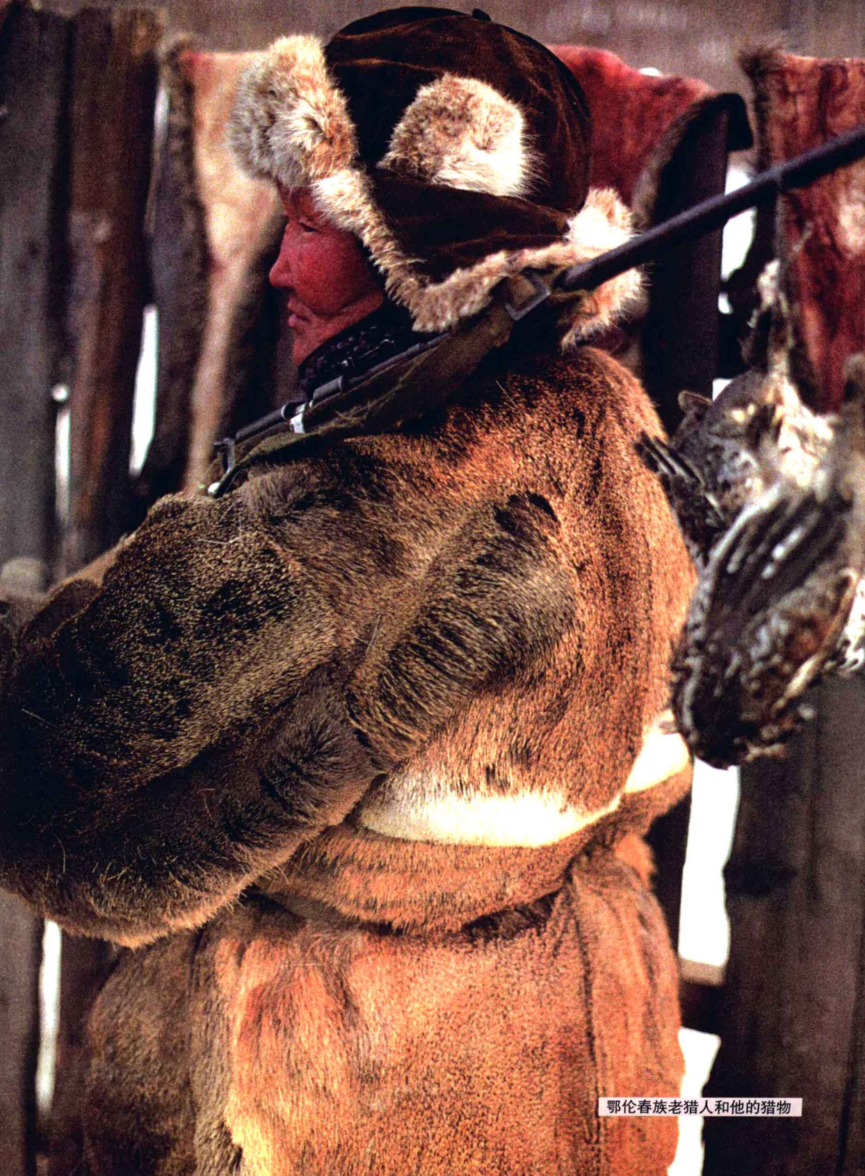
鄂伦春族老猎人和他的猎物