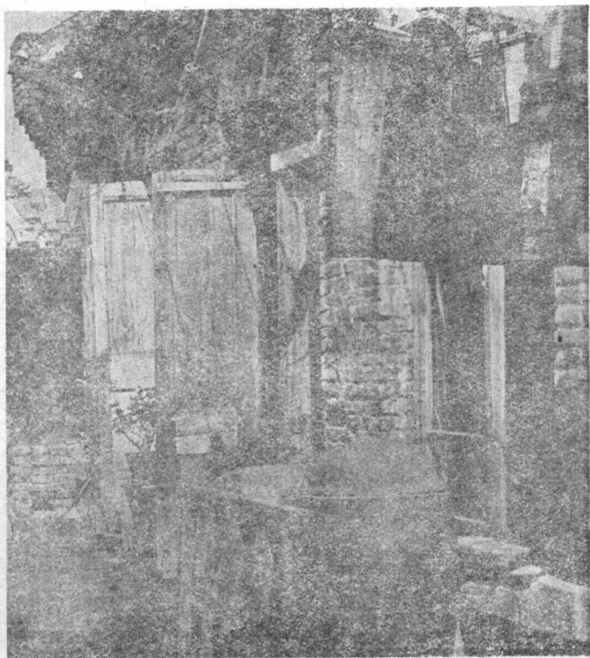
一九二九年滿洲省委秘書處活動地點