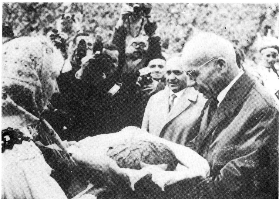
哥穆尔卡在群众中