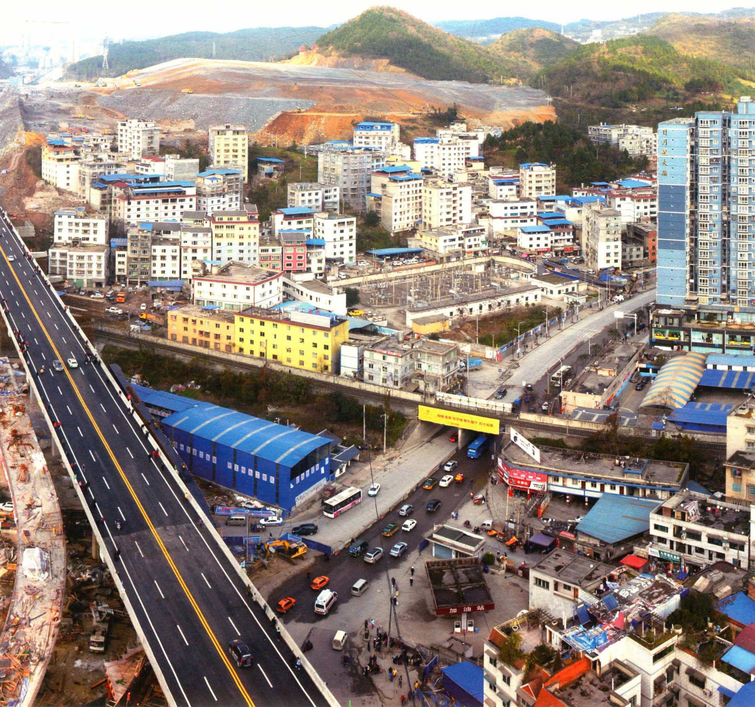
遵义市九节滩立交及主干道