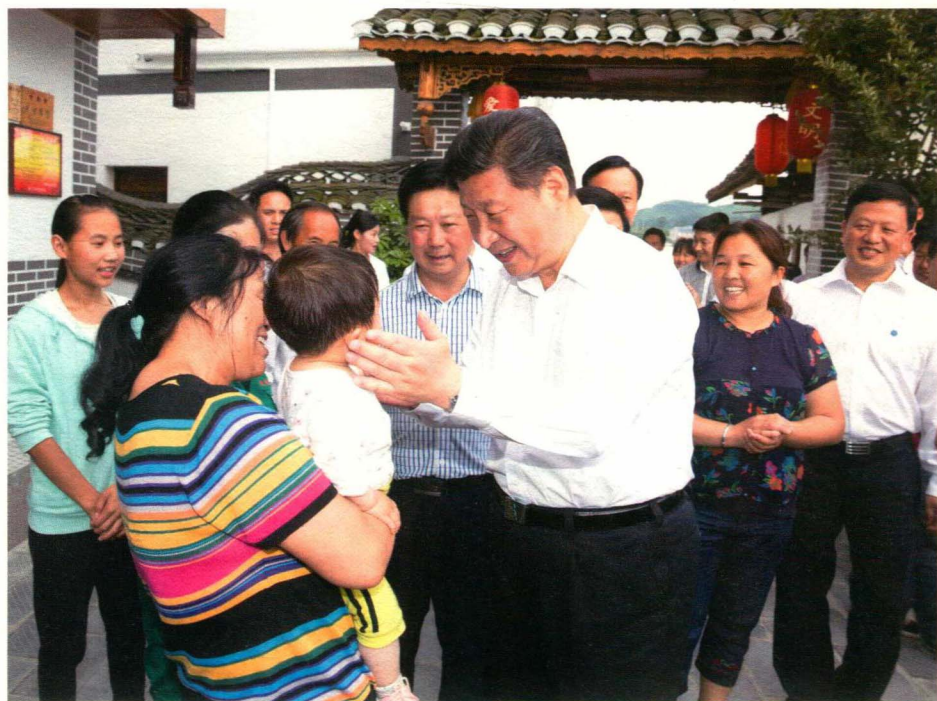
6月16日下午，习近平总书记在遵义县枫香镇花茂村看望村民。