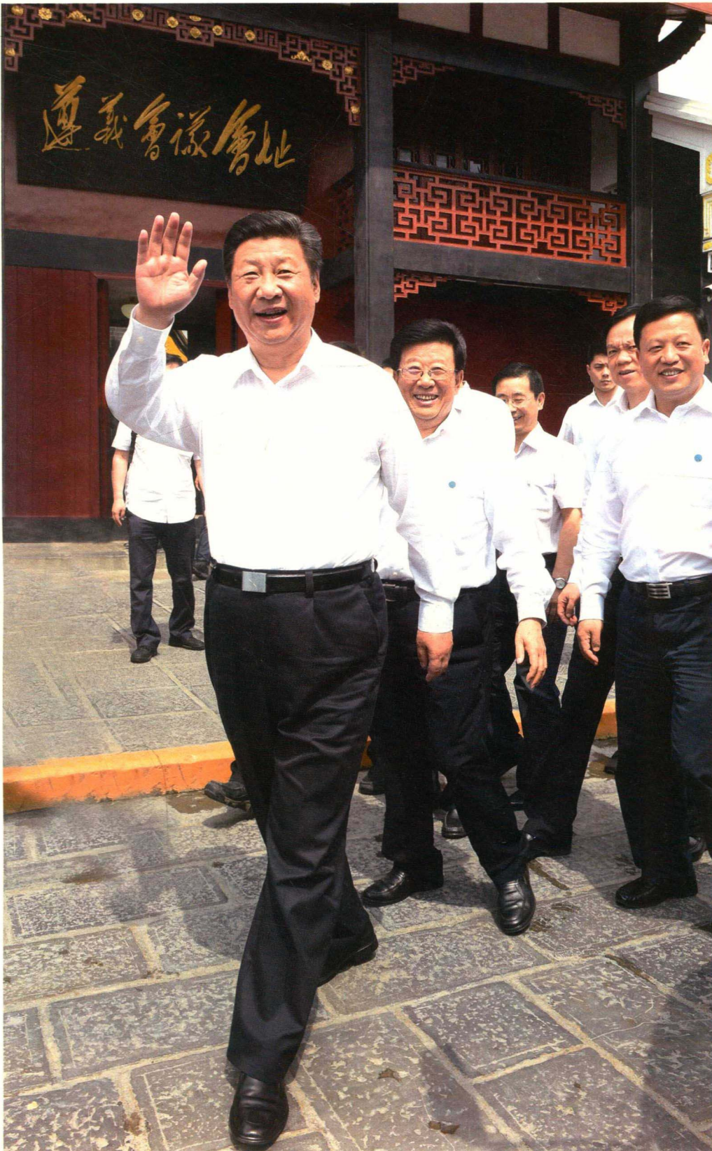
习近平总书记参观遵义会议会址