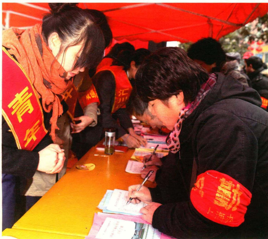
市民踊跃填表加入双创志愿者