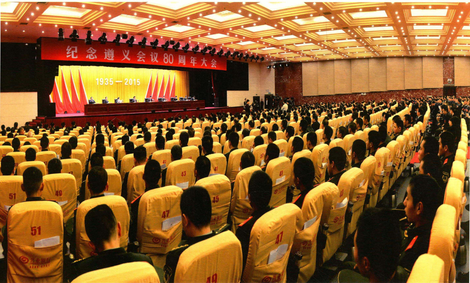
纪念遵义会议 80 周年大会

2015年1月15日，中宣部、中央文献研究室、中央党史研究室、解放军总政治部、贵州省委在遵义举行纪念大会，隆重纪念遵义会议召开80周年，中共中央政治局委员、中央书记处书记、中宣部部长刘奇葆出席并发表讲话。他指出，遵义会议是我们党的历史上一个生死攸关的转折点，在极端危急的历史关头，挽救了党，挽救了红军，挽救了中国革命，打开了中国革命的新局面。遵义会议的重大历史贡献，永载史册、永放光辉。