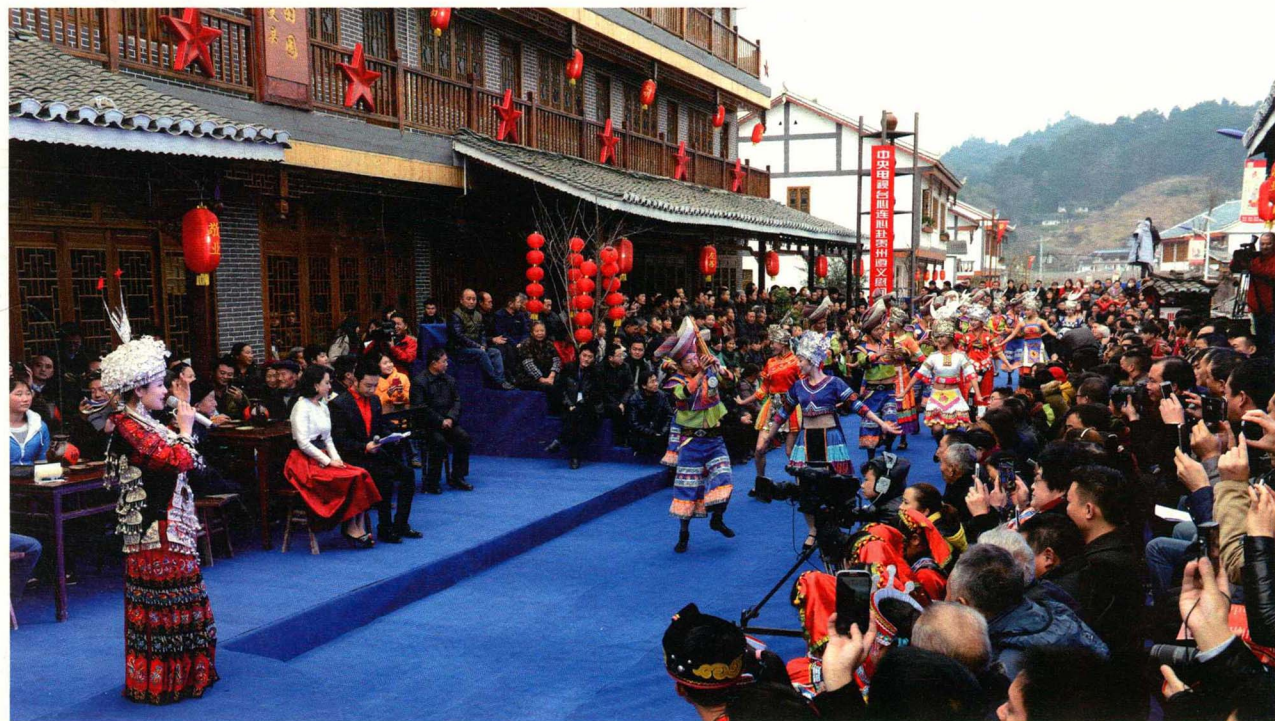
中央电视台“心连心”艺术团遵义慰问演出