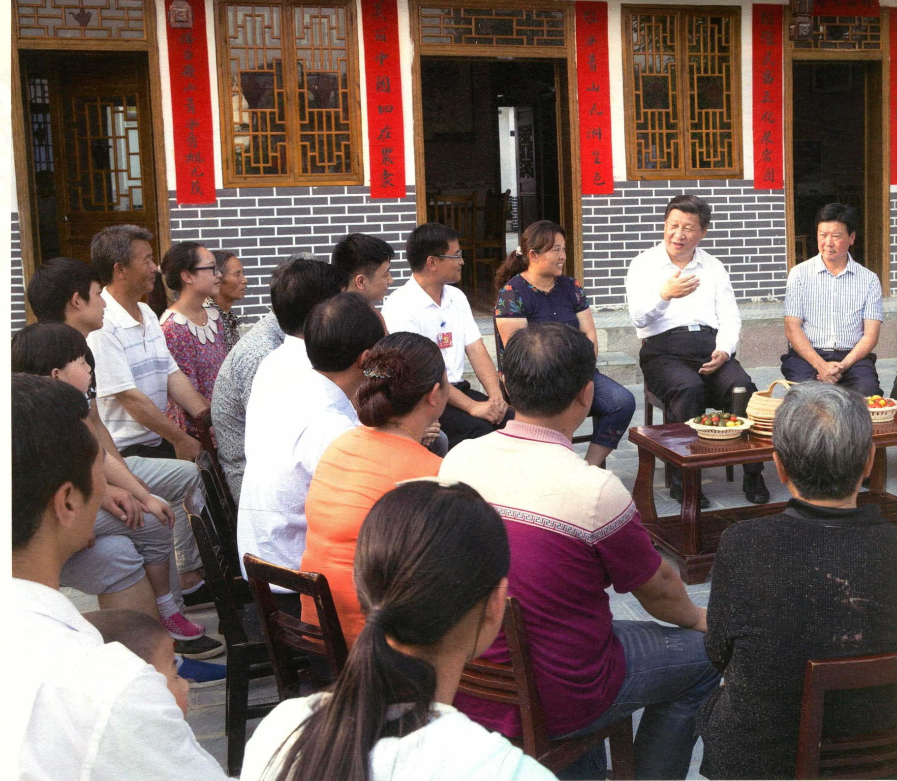
2015年6月16日下午，习近平总书记在遵义县枫香镇花茂村同村民座谈。