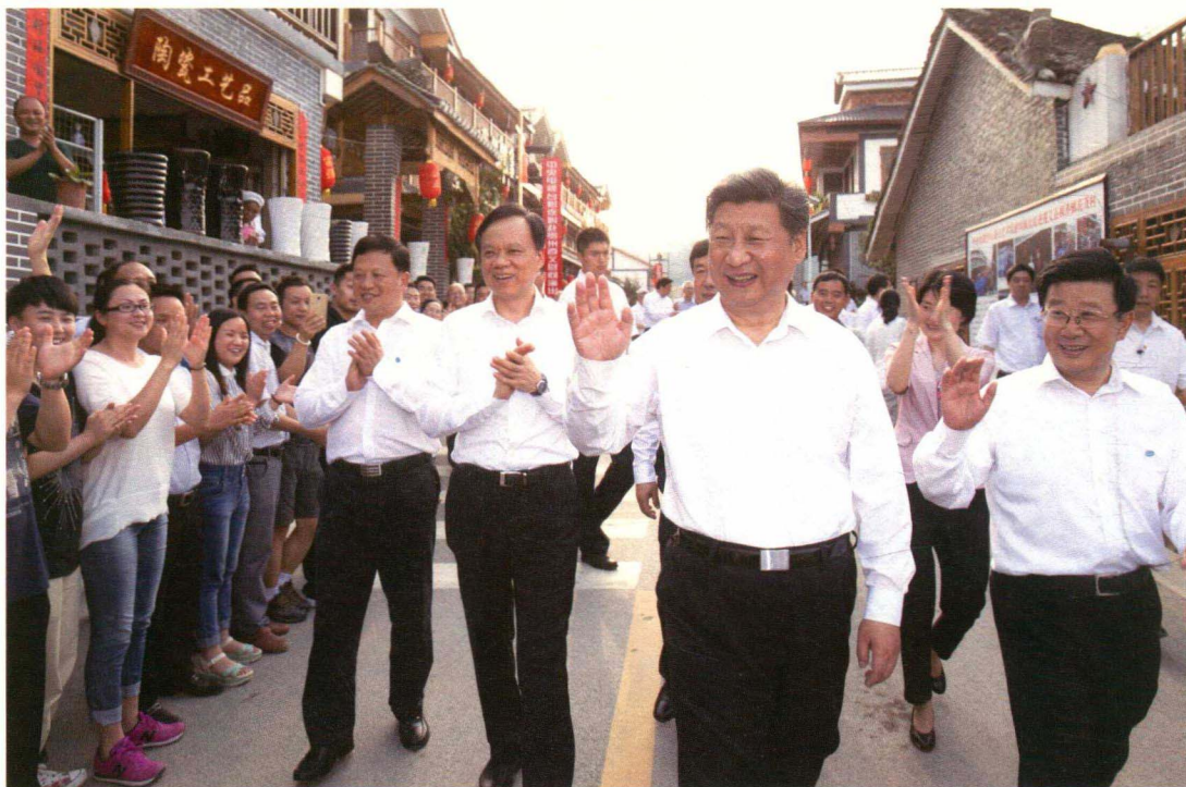
习近平总书记与花茂村村民亲切交流