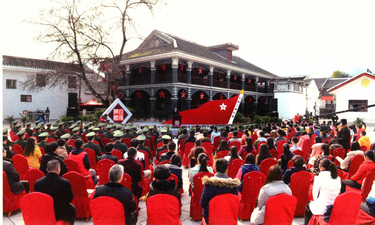
中央电视台《百家讲坛》“长征与遵义”电视讲座