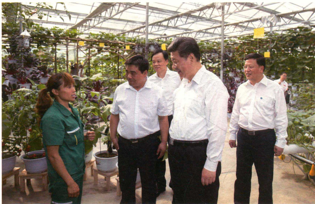
习近平总书记参观枫香蔬菜现代高效农业园区