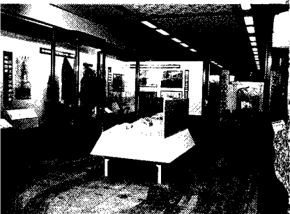
回族文物习指展厅