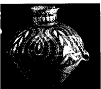
彩陶罐(新石器时代) 西夏义斌碑(西夏)