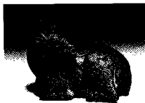
错金银铜羊(汉代) 鎏金铜牛(西夏)