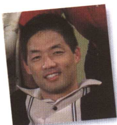
Name: Takeshi Mifune Age: 26 Hometown: Osaka, Japan Profession: film student

"City Living" is the story of the day-to-day lives of six friends living, studying, and working in New York City. Takeshi Mifune is a film student from Osaka, Japan. He lives with his best friend Mike Johnson, a struggling actor from Minneapolis, Minnesota. Tara Greene is a student and waitress from Nottingham, England. Her roommates are Sun-hee Park, a computer instructor from Seoul, Korea (R.O.), and Claudia Oliveira, a software sales manager from Rio de Janeiro, Brazil. Claudia's boyfriend, Roberto Chavez, is a financial analyst from Mexico City, Mexico. Interesting, exciting, and always fun—that's "City Living"!