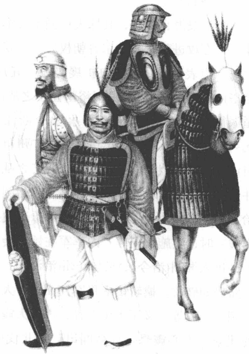
南北朝武士复原图

江之蒜山，刘裕率领所部奔击，大破之，投崖赴水死者甚众。孙恩失利，退至船上，欲恃其兵众，整兵直攻建康(今江苏南京)。晋后将军司马元显率军拒战，屡被打败。义军因战船高大，逆行慢，数日才进至白石垒(今南京市西)，贻误了战机，所以刘牢之等得以率军尾追而来。孙恩遂放弃攻建康，分兵袭取北岸之广