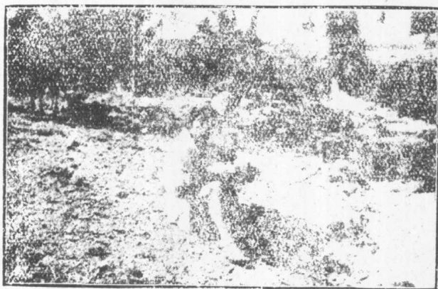
此系夷族除黑白夷外所稱水田也是