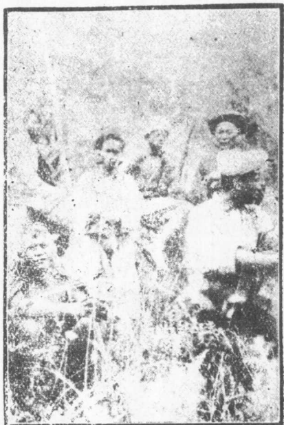
越嵩東山夷酋呷孤都及所率夷人