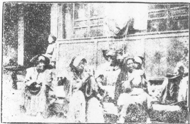
越巖夷婦在漢族街市常地紡織毛線情形