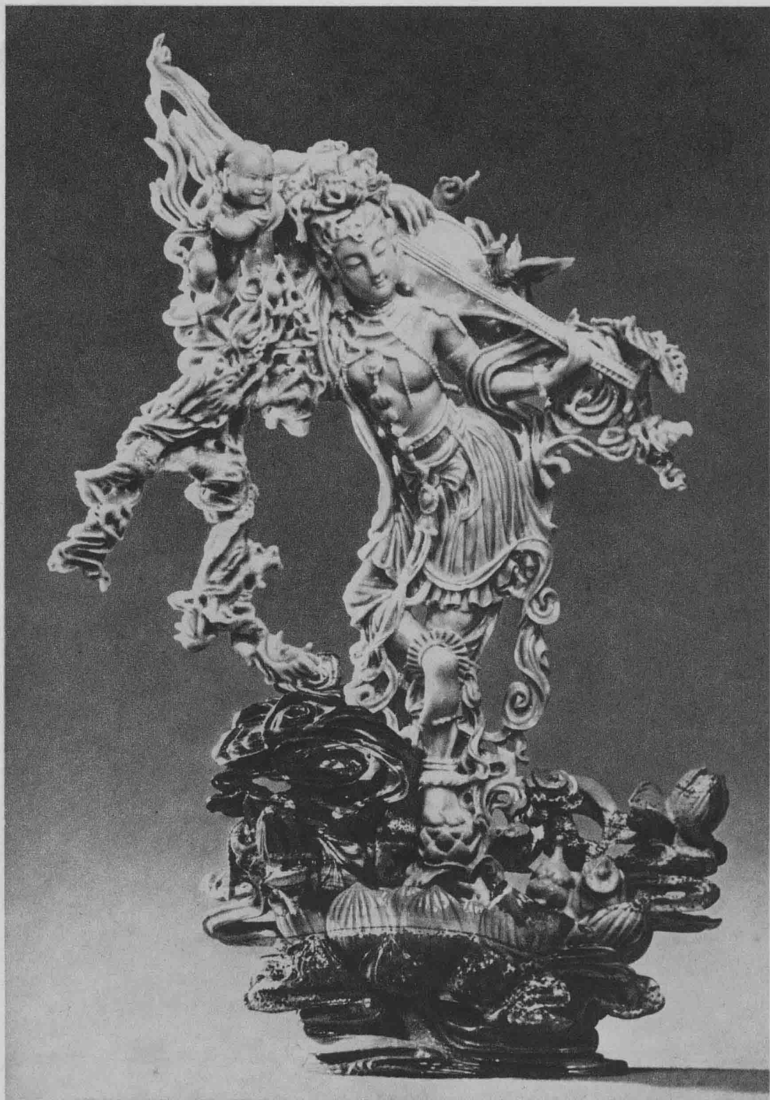
反弹琵琶伎乐天（珊瑚）