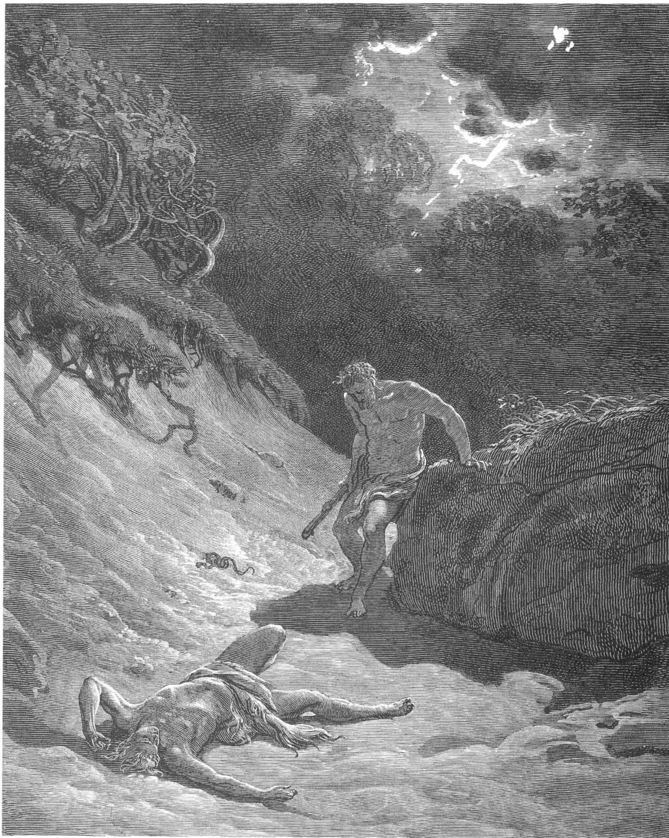
妒火中烧的该隐把弟弟亚伯击倒在地，杀死了他