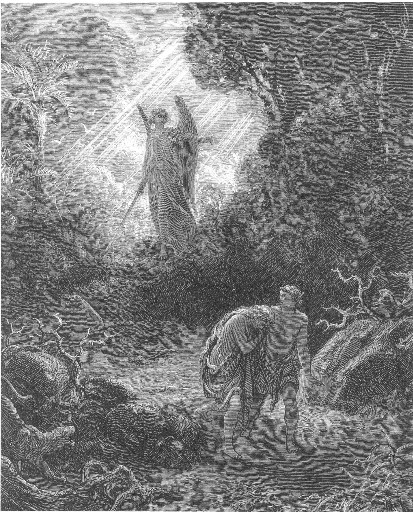
亚当、夏娃被逐出伊甸园