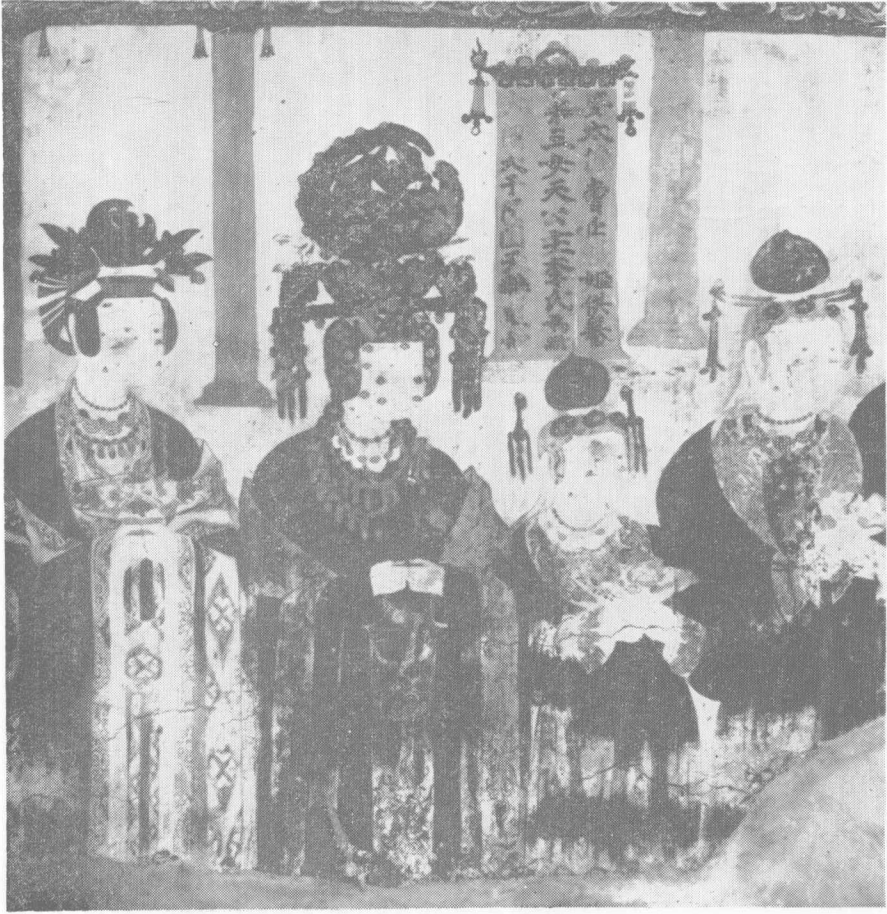
第61窟东壁于阗公主李氏供养像（宋）