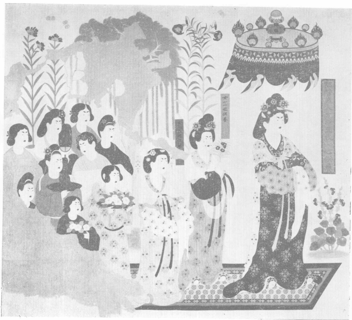
第130窟甬道北壁都督夫人太原王氏等供养像（盛唐）