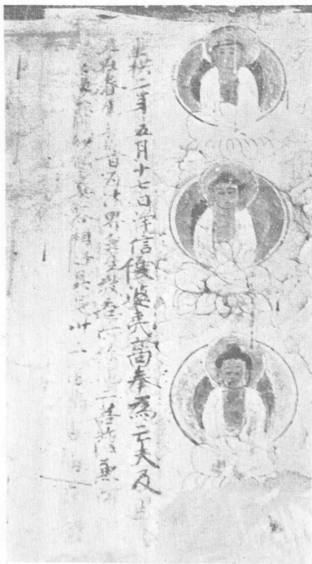
第335窟东壁优婆夷发愿文（初唐）