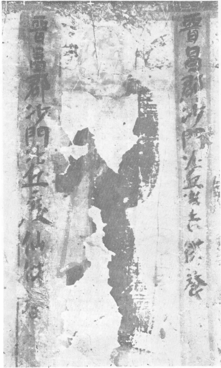
第428窟东壁晋昌郡沙门比丘庆仙供养题记（北周）