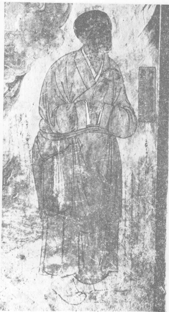
第61窟甬道南壁扫洒尼供养像（元）