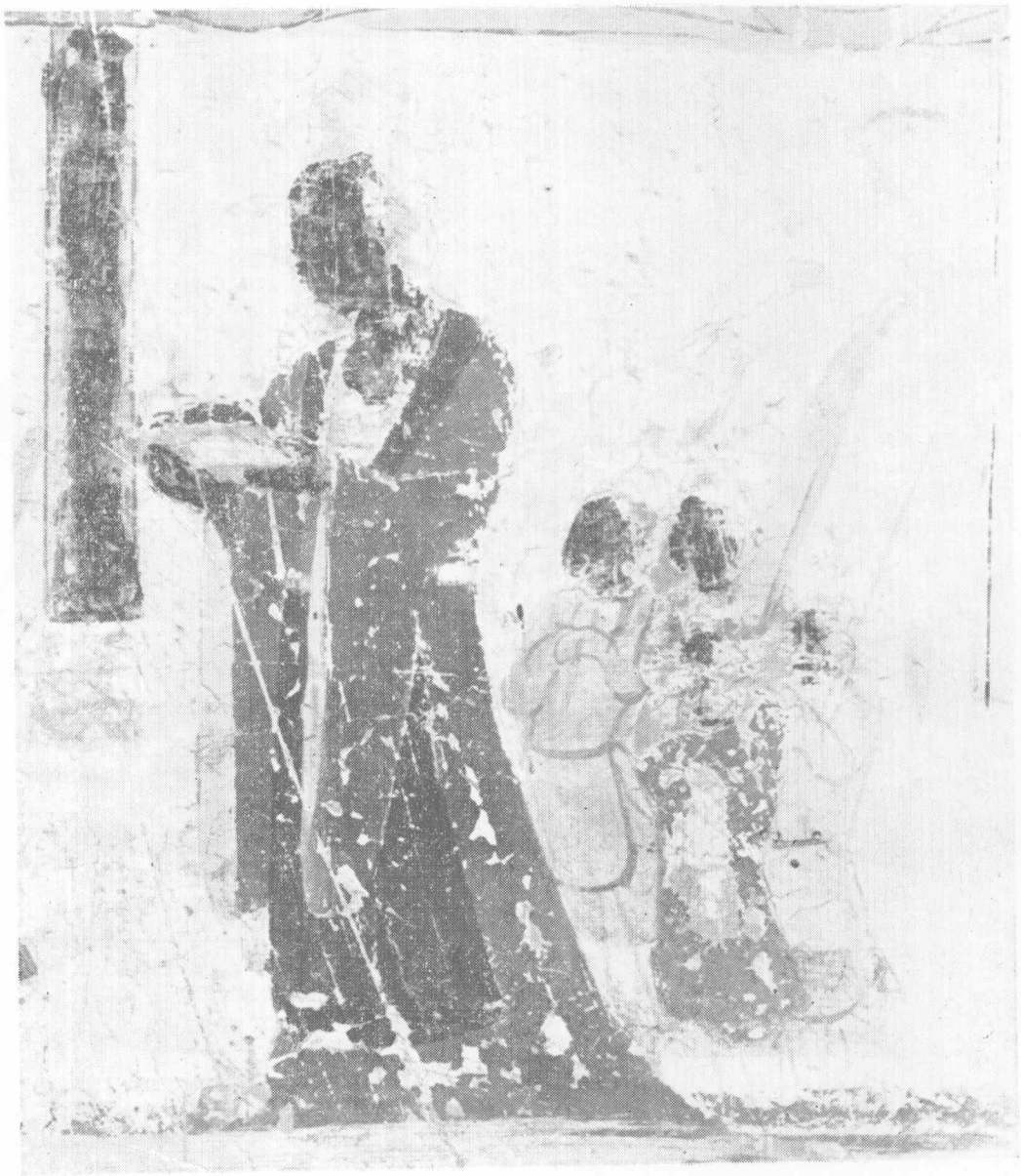
第390窟北壁幽州总管府长史供养像（初唐）