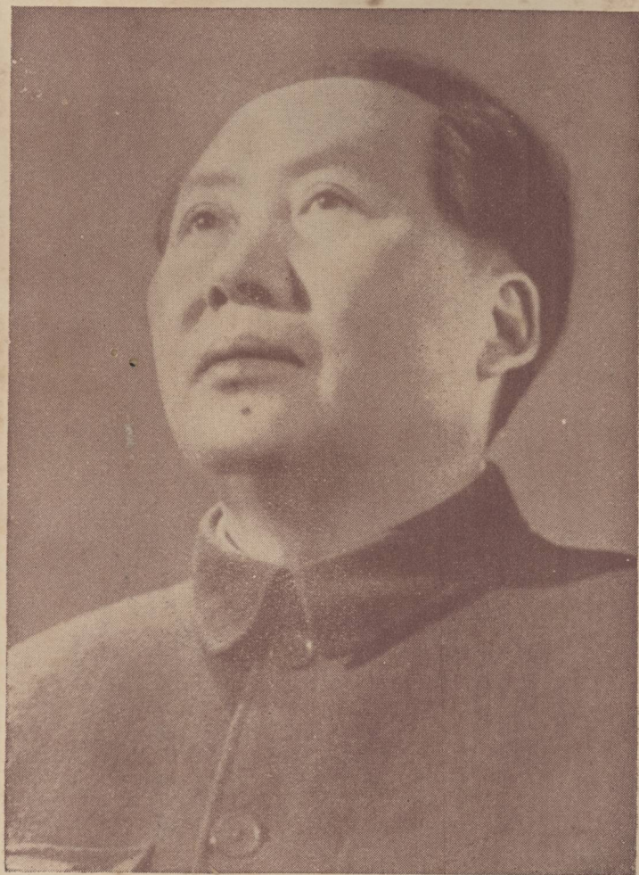
毛 主 席