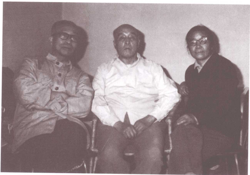
绿原、罗惠看望劫后的胡风先生