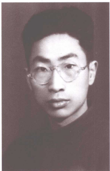
作者青年时期 (20世纪40年代)