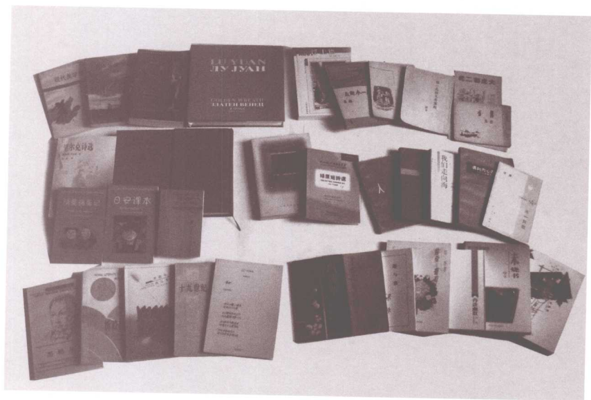
绿原著译主要部分