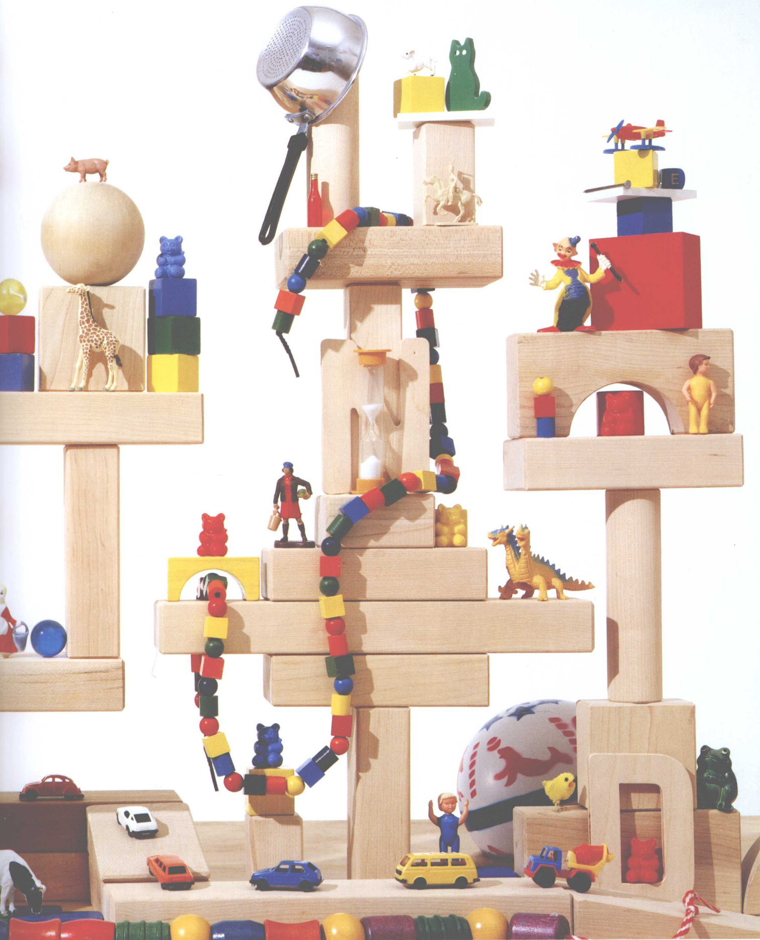
红色瓶子圆圆身，工艺木棒圆圆头， 组成HAND的字母分散开，黄色橡皮筋扭一扭。