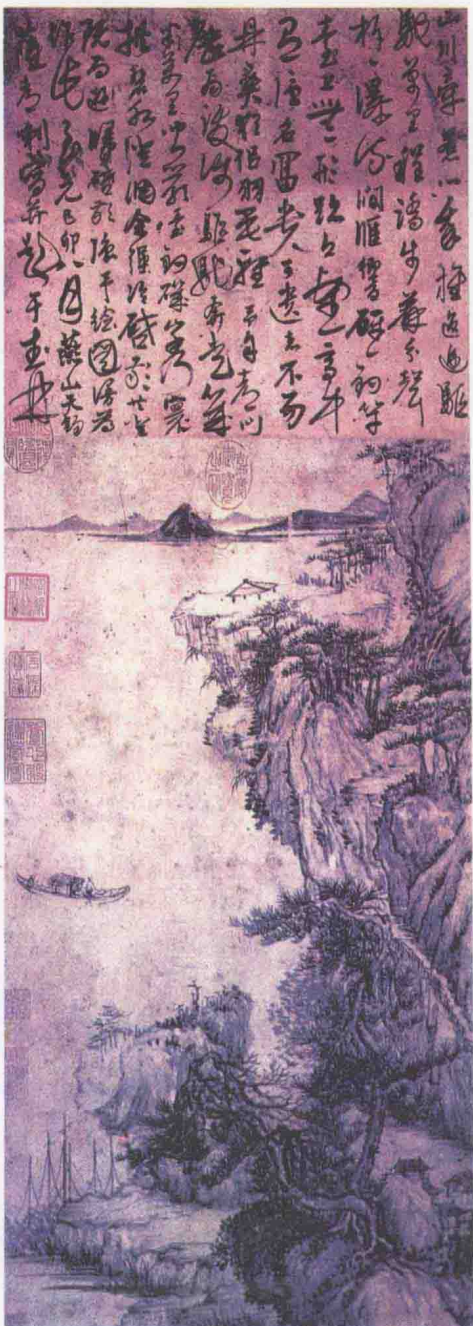
錄自《中國大百科全書·中國文學》卷一 彩插五三