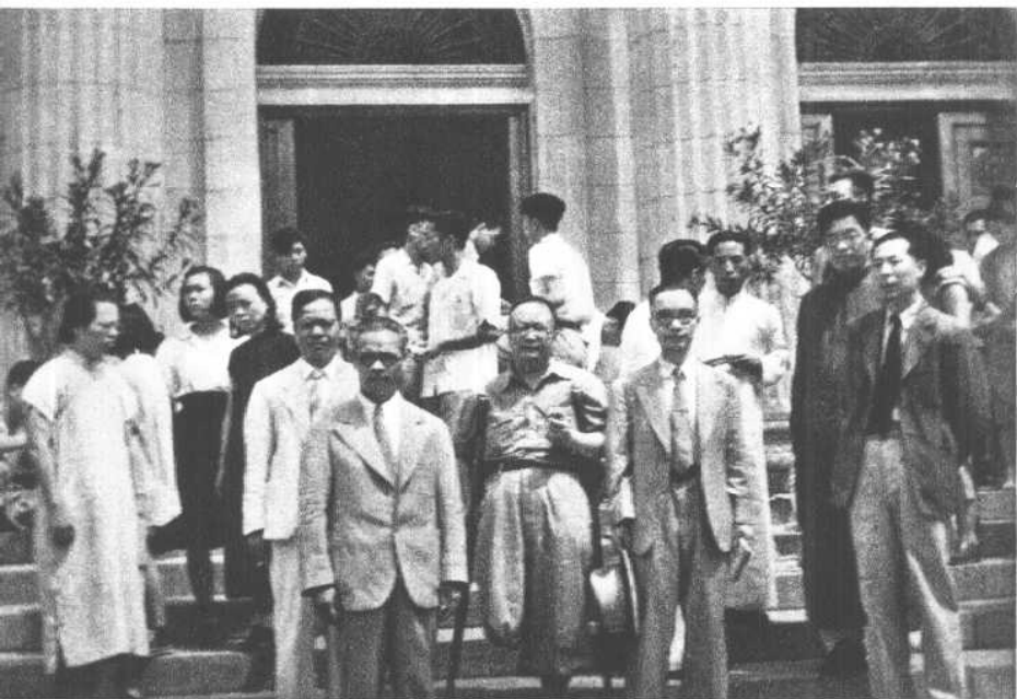
闻一多先生逝世一周年纪念会后，于清华大学图书馆前合影。吴晗、张奚若、潘光旦、朱自清。（一九四七年）