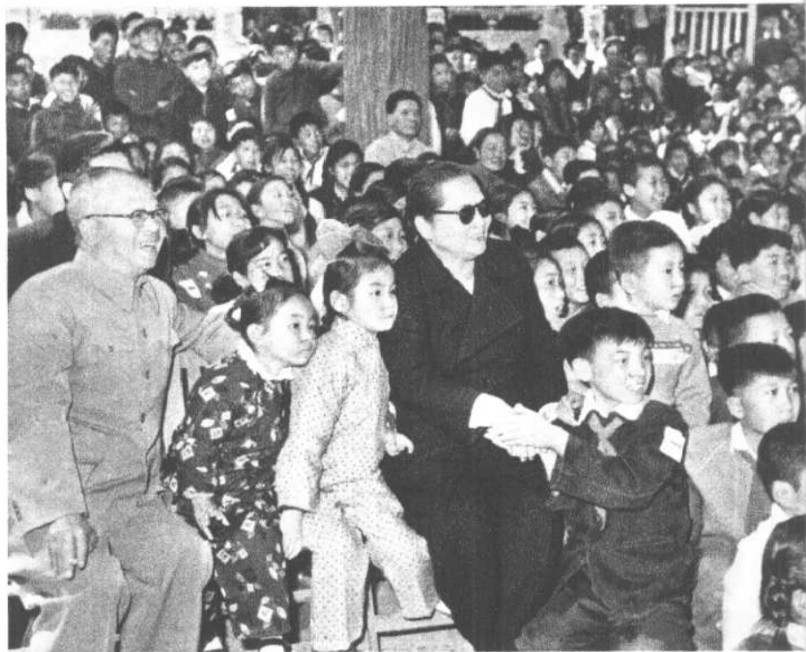
吴晗同志和宋庆龄副主席同孩子们在一起。