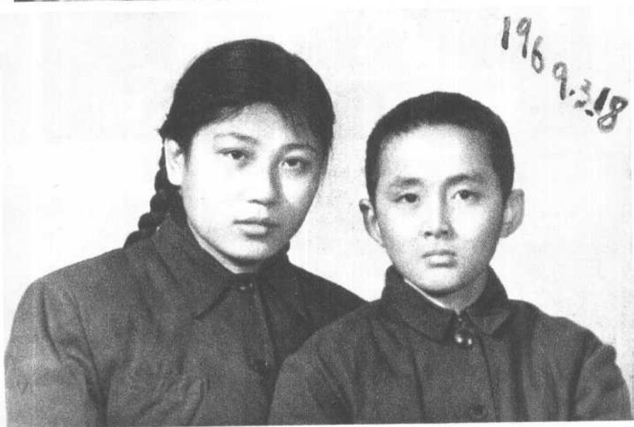
悲哀的日子——妈妈死了。（一九六九年）