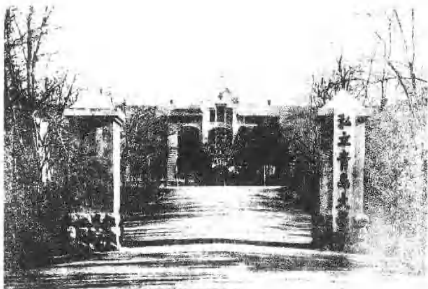
7 私立青島大學的校址