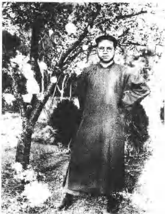
8 1925年羅榮桓在青島大學讀書時，在櫻花村前留影