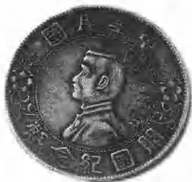
13 这是使罗荣桓幸免伤亡的一块银元