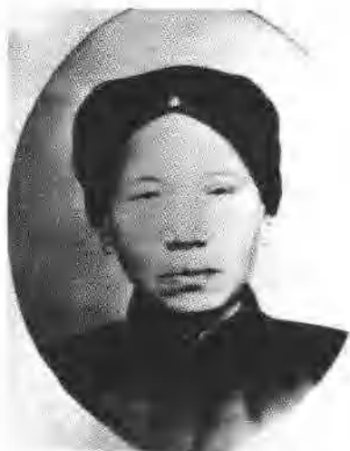
6 罗荣桓的母亲罗贺氏