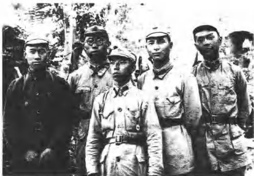
14 1935年10月，罗荣桓(左二)和第一军团政治部部分同志合影