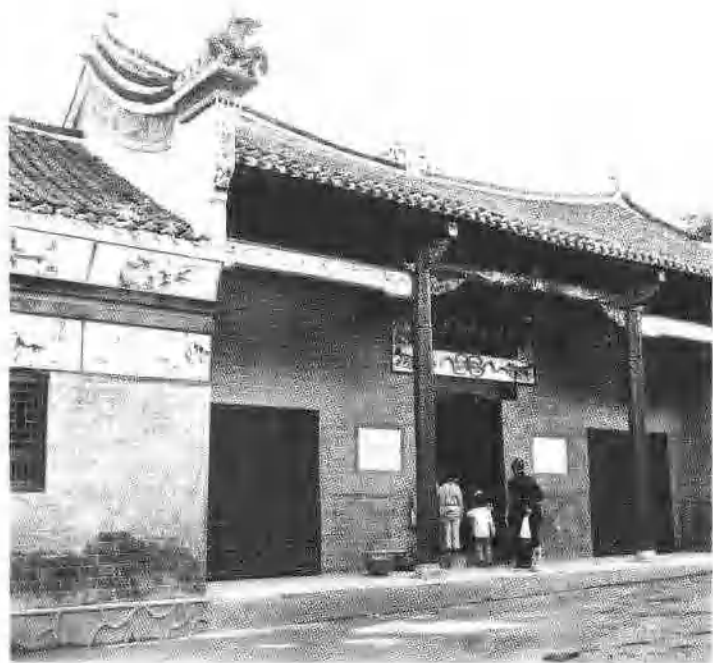
4 罗荣桓的故居， 原罗氏异山享祠