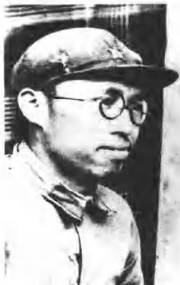
12 罗荣桓长征后到达陕北