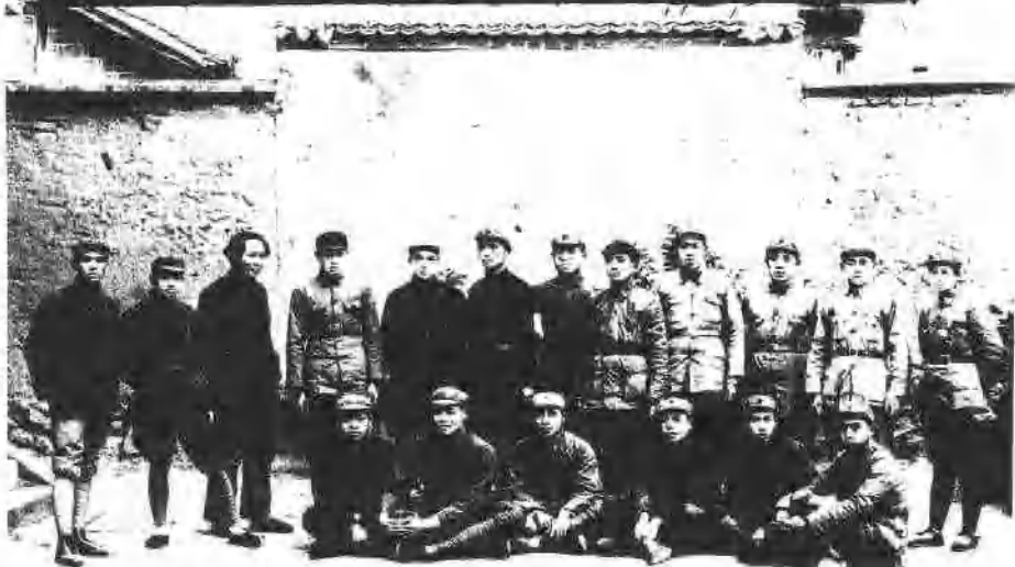
9 1927年秋收暴动后成立的工农革命军第一军第一师的部分同志，十年后在延安合影