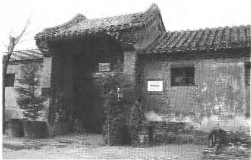
3 位于北京骡马市大街烂漫胡同内的湖南会馆旧址。 罗荣桓曾在这里补习功课一年