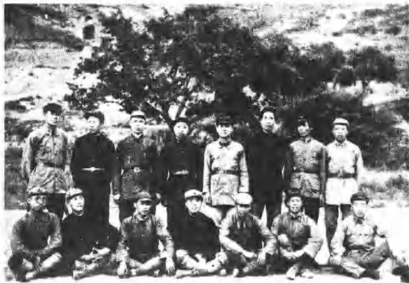
10 当年参加井冈山斗争的部分同志合影