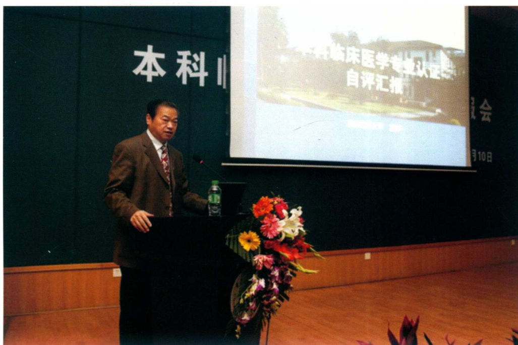
12月10日，学校临床医学专业接受国际认证