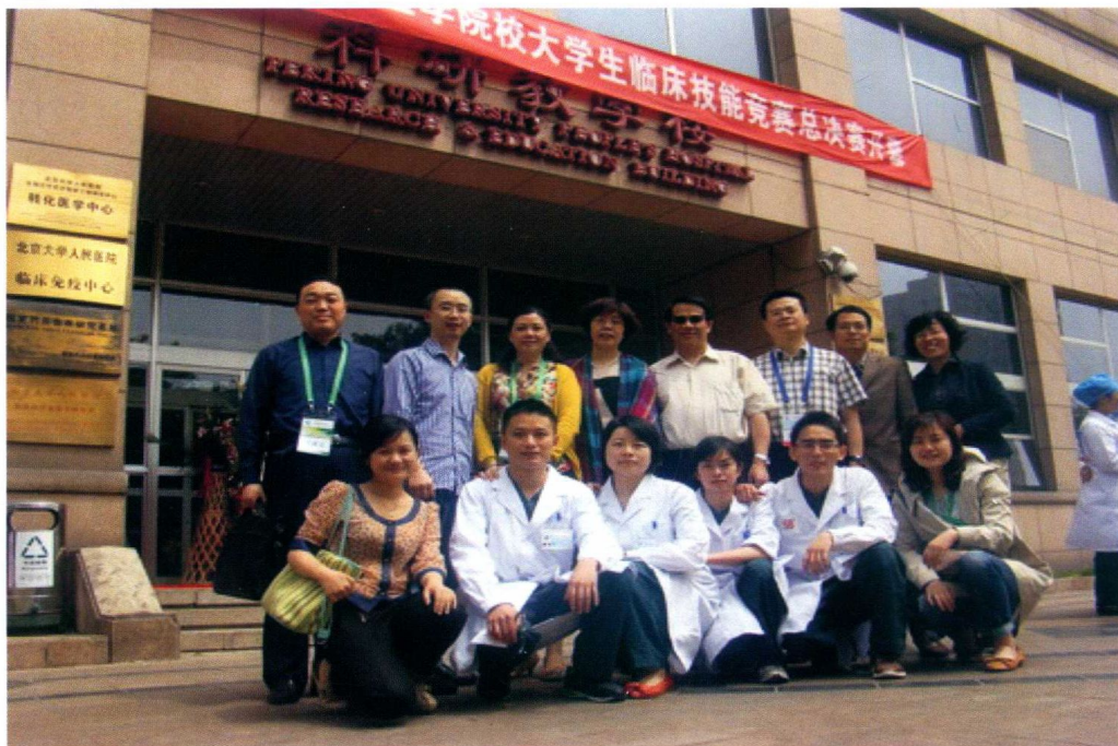
5月12日至13日，重庆医科大学获第三届全国高等医学院校大学生临床技能竞赛总决赛特等奖