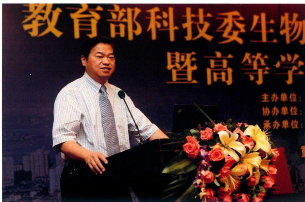
5月11日至12日，重庆医科大学承办的教育部科学技术委员会生物与医学学部2012年全委会暨高等学校协同创新论坛举行