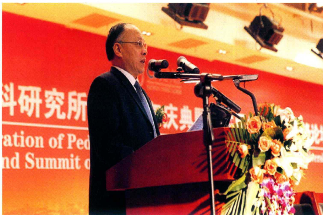
4月5日，重庆医科大学儿科研究所二十周年庆典暨儿科医学与药学发展高峰论坛开幕，重庆市政协副主席谢小军出席并致辞