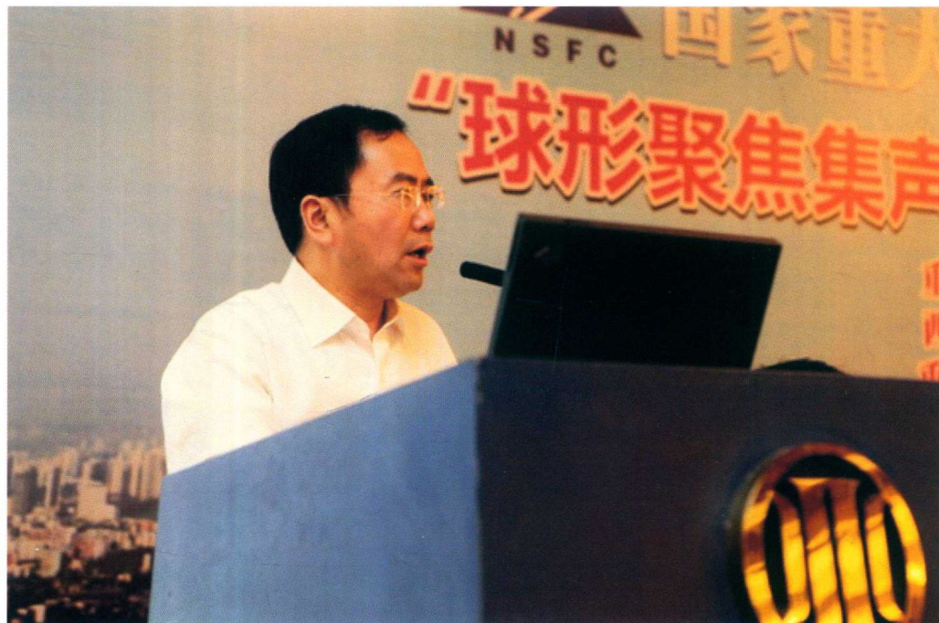
5月5日，由重庆医科大学承担的国家重大科研仪器专项“球形聚焦集声系统的研究”项目启动会召开，副市长吴刚出席并致辞