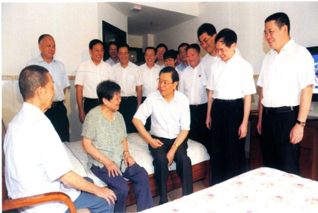
8月28日，重庆市委书记张德江考察重庆医科大学附属第一医院青杠老年护养中心