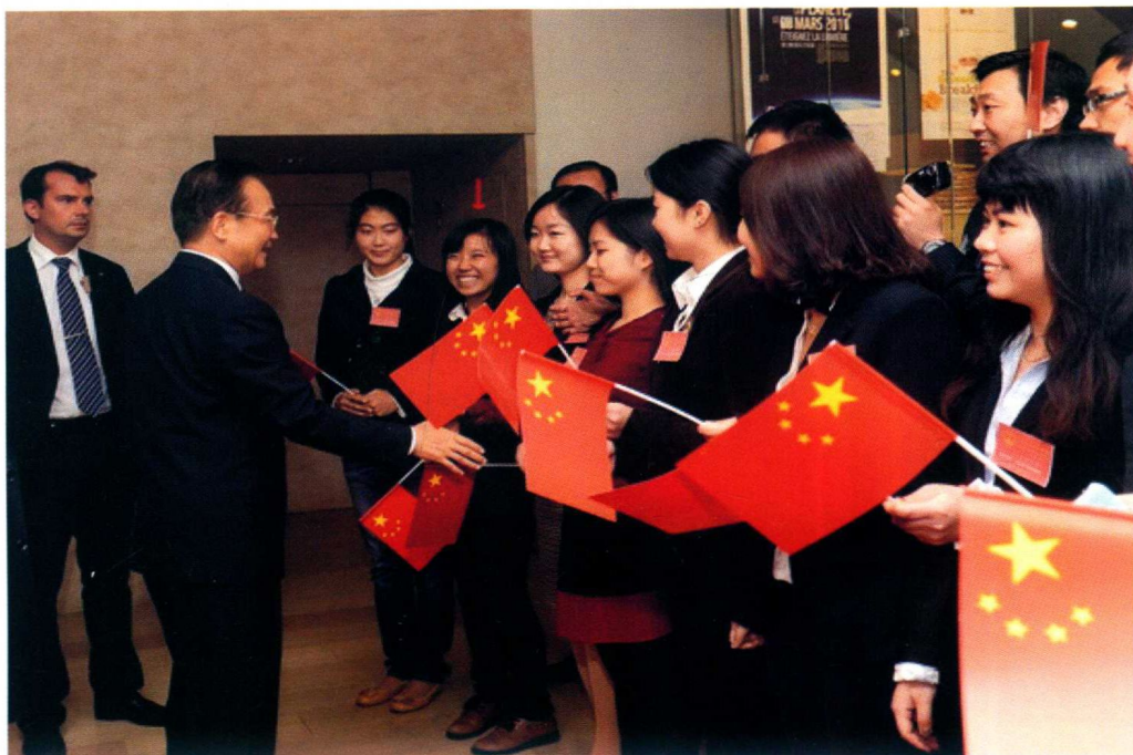
9月19日，重庆医科大学教师代表在比利时受到温家宝总理接见