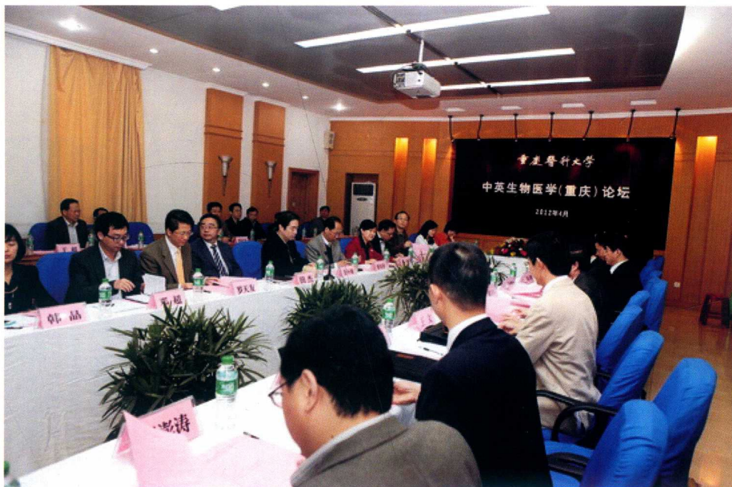
4月9日至4月11日，由重庆医科大学主办的首届中英生物医学（重庆）论坛召开