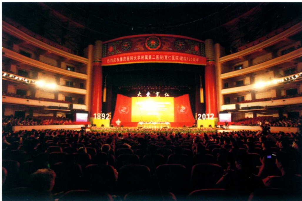
9月22日，重庆医科大学附属第二医院举行建院120周年庆典活动