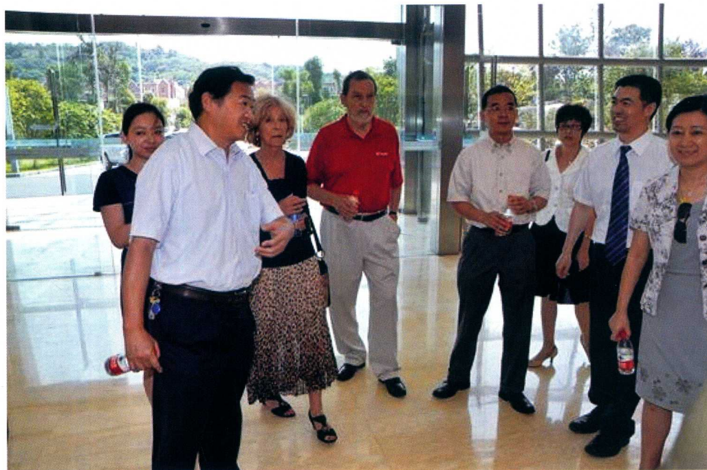
7月27日，美国辛辛那提大学副校长鲍特访问重庆医科大学