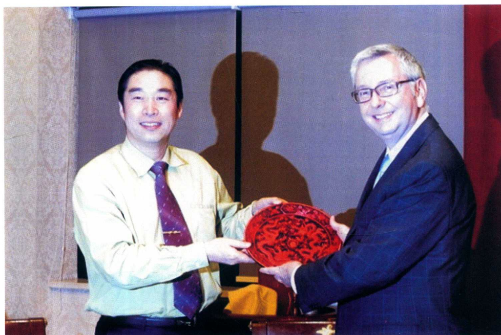
12月14日至17日，加拿大UBC大学校长访问重庆医科大学附属儿童医院