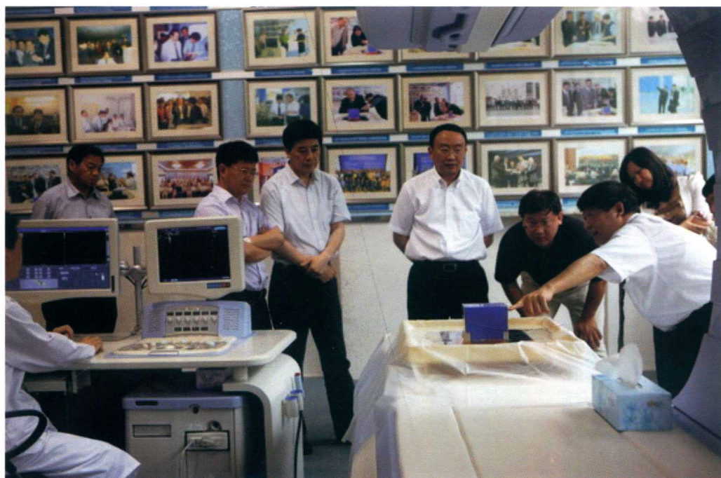
6月17日，教育部科技司副司长雷朝滋考察学校国家工程研究中心