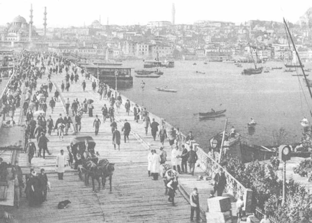
19 世纪末 20 世纪初君士坦丁堡的繁荣景象

保护神——一位年老体衰的老婆婆在一夜之间变成了美丽的少女。梦醒时分，他感到这是个吉兆，就决定遵循神的选择，开始在这里建设新都。看来，无论是多么伟大的统治者，都多多少少有那么点迷信，而君士坦丁大帝的迷信还不是一点点。6 年后，这座新都已经初具规模，君士坦丁大帝举行了盛大的迁都仪式，并以自己的名字命名其为君士坦丁堡。此后这座城市就以君士坦丁堡的名称载入史册，见证了这个帝国的辉煌历史，直到 1453 年，奥斯曼土耳其人攻陷了君士坦丁堡，拜占庭帝国末代王朝帕列奥列格王朝灭亡，辉煌一时的帝国由此消失在历史的长河中，这座城市也随着土耳其人的统治而变成了一座伊斯兰教的城市，即今天的