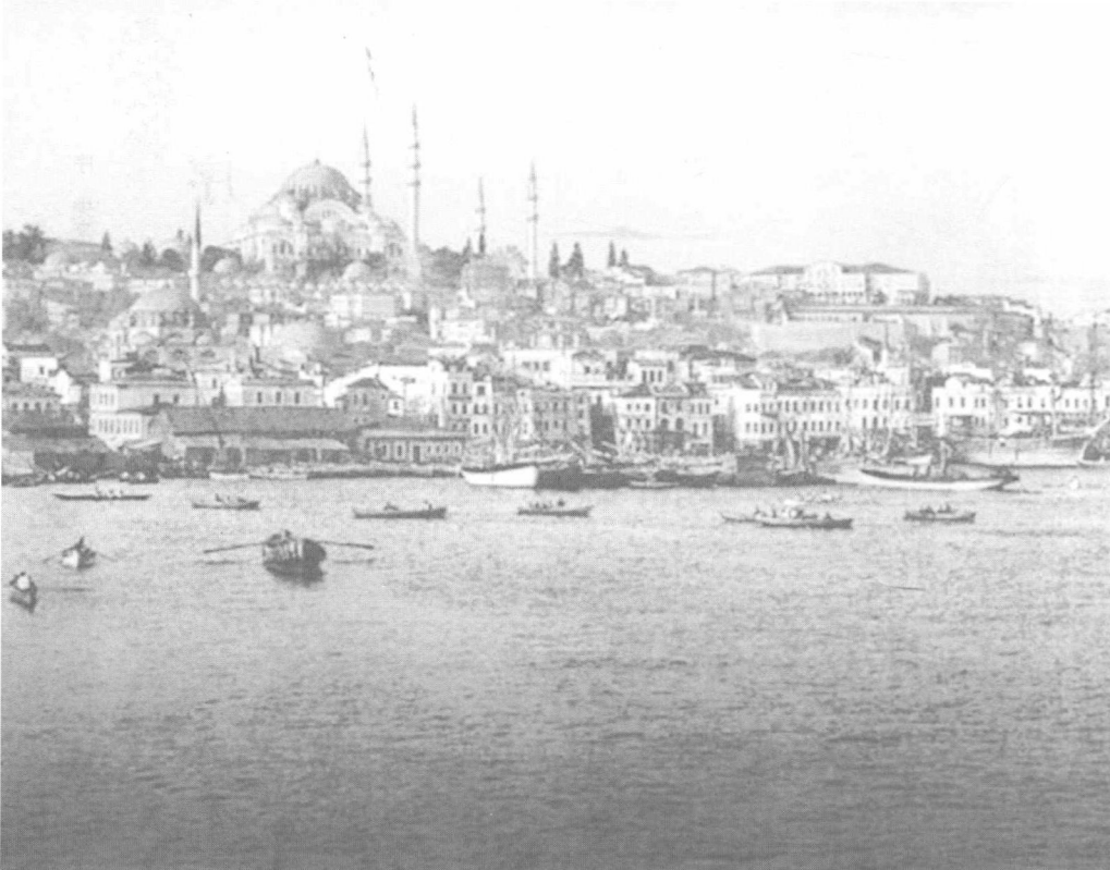
拜占庭帝国首都君士坦丁堡（今土耳其首都伊斯坦布尔）今貌