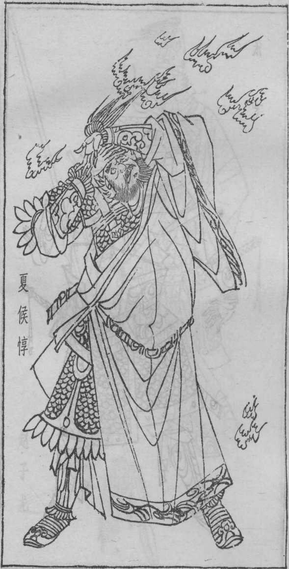
夏 候 惇