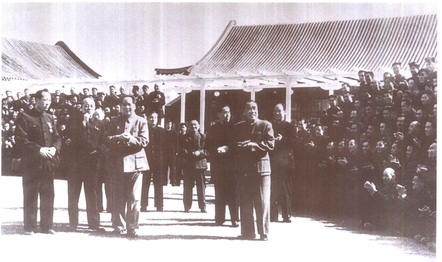
□ 毛泽东和周恩来、朱德、陈云、邓小平、彭真等同志会见全国煤炭先进工作者代表大会代表（1956年）