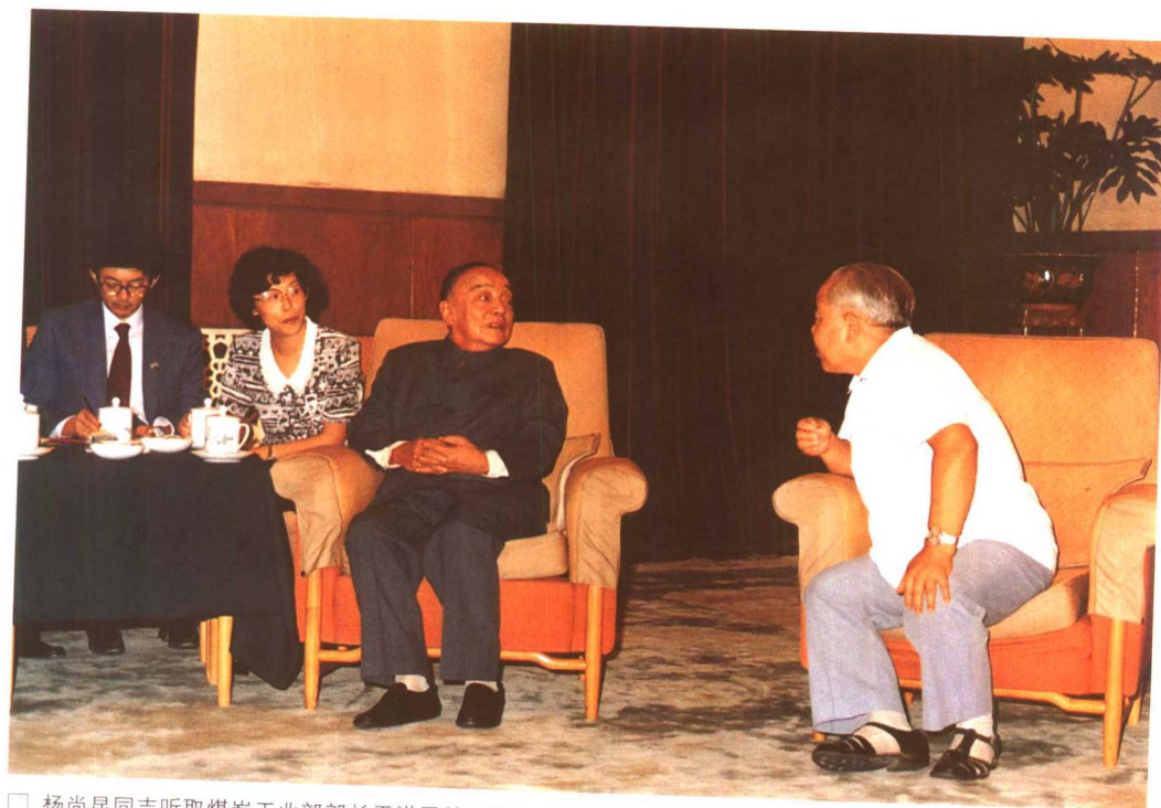
□ 杨尚昆同志听取煤炭工业部部长于洪恩的工作汇报（1987年）