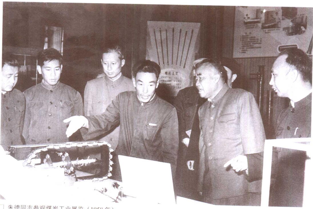
□ 朱德同志参观煤炭工业展览（1958年）