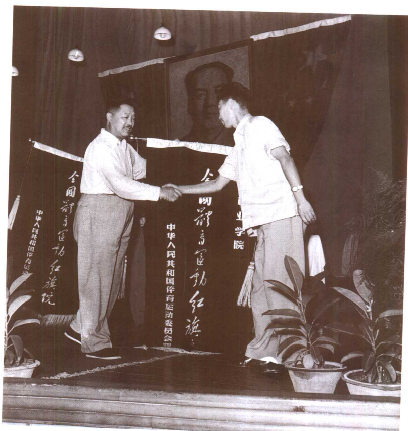
□ 贺龙同志代表国家体委向北京矿业学院授旗（1964年）