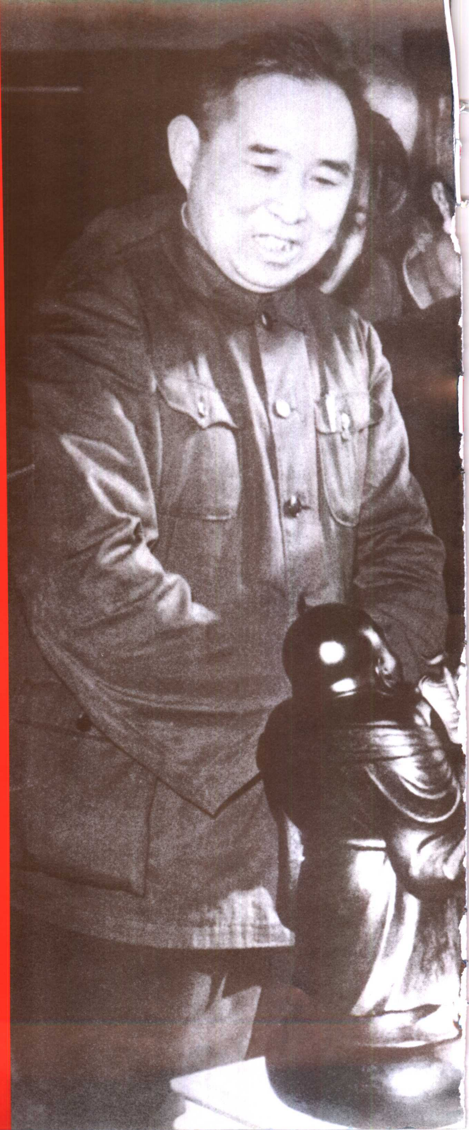
□ 毛泽东同志视察抚顺露天矿时在休息室观看煤精雕刻（1958年）