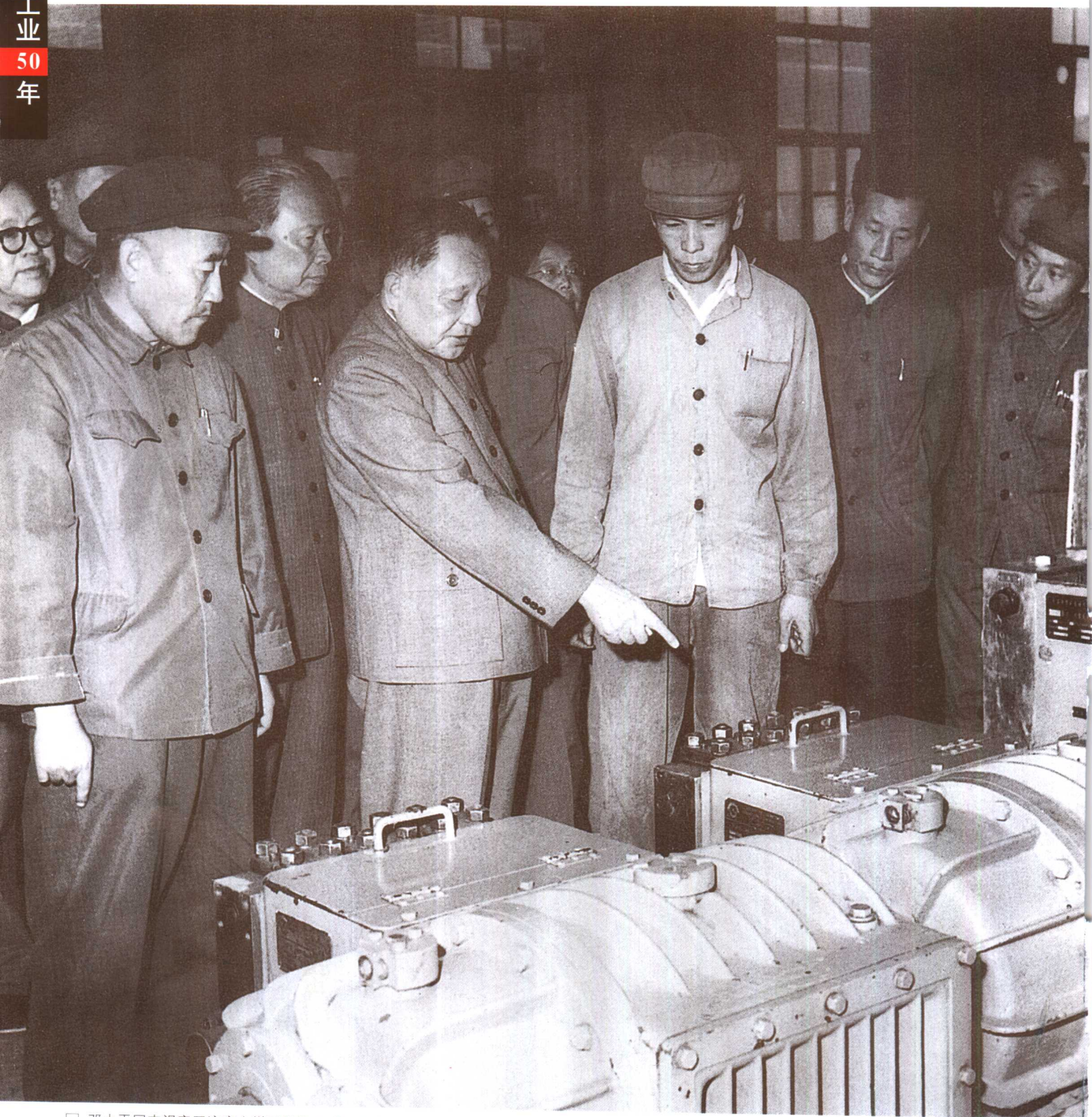
□ 邓小平同志视察开滦唐山煤矿机修厂（1979年）