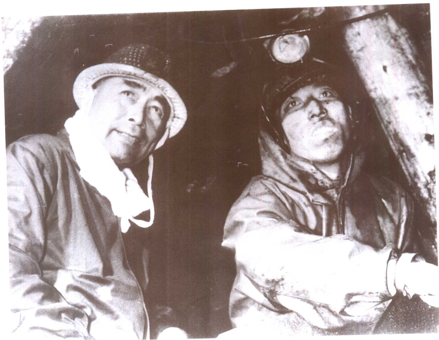
□ 周恩来同志视察开滦唐家庄煤矿水力采煤并亲手试采（1958年）