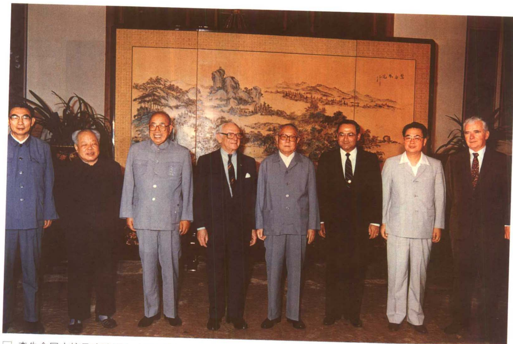
□ 李先念同志接见哈默博士（1985年）