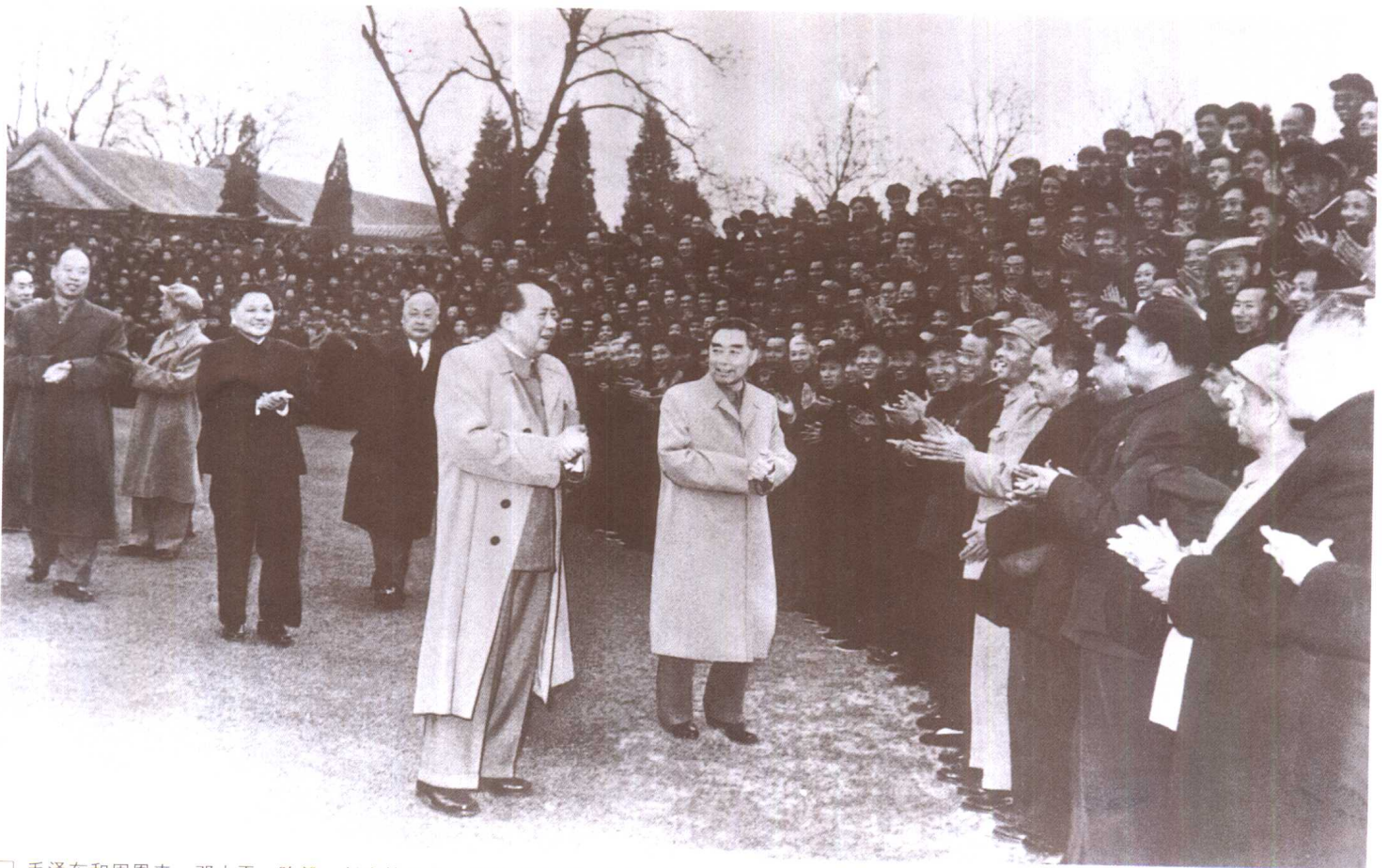
□ 毛泽东和周恩来、邓小平、陈毅、彭真等同志接见煤矿职工代表（1963年）