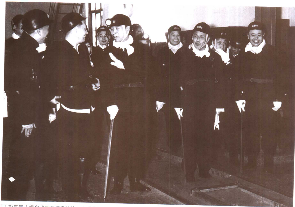
□ 彭真同志视察我国自行设计施工建成的第一座现代化矿井——开滦范各庄矿（1965年）