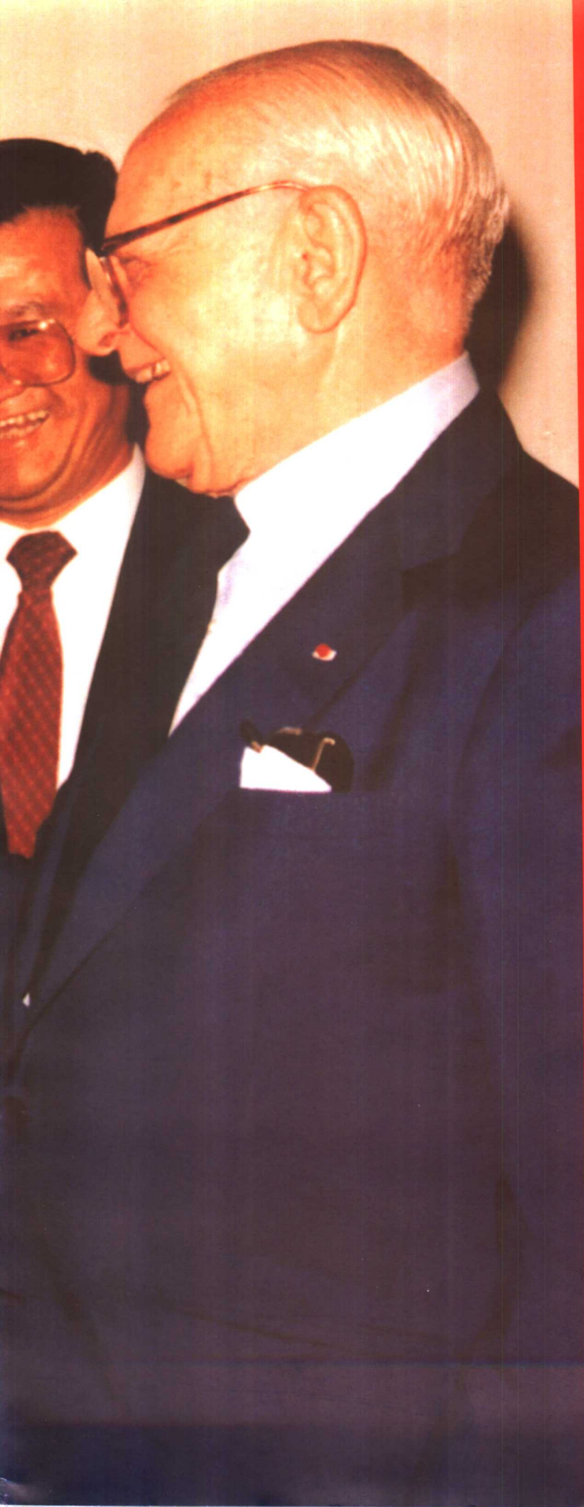
□ 邓小平同志与美国西方石油公司总裁哈默博士就合作开发安太堡露天矿进行会谈（1987年）