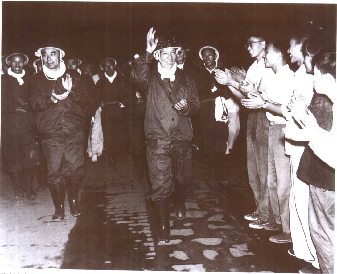
□ 刘少奇和周恩来同志视察开滦煤矿（1958年）