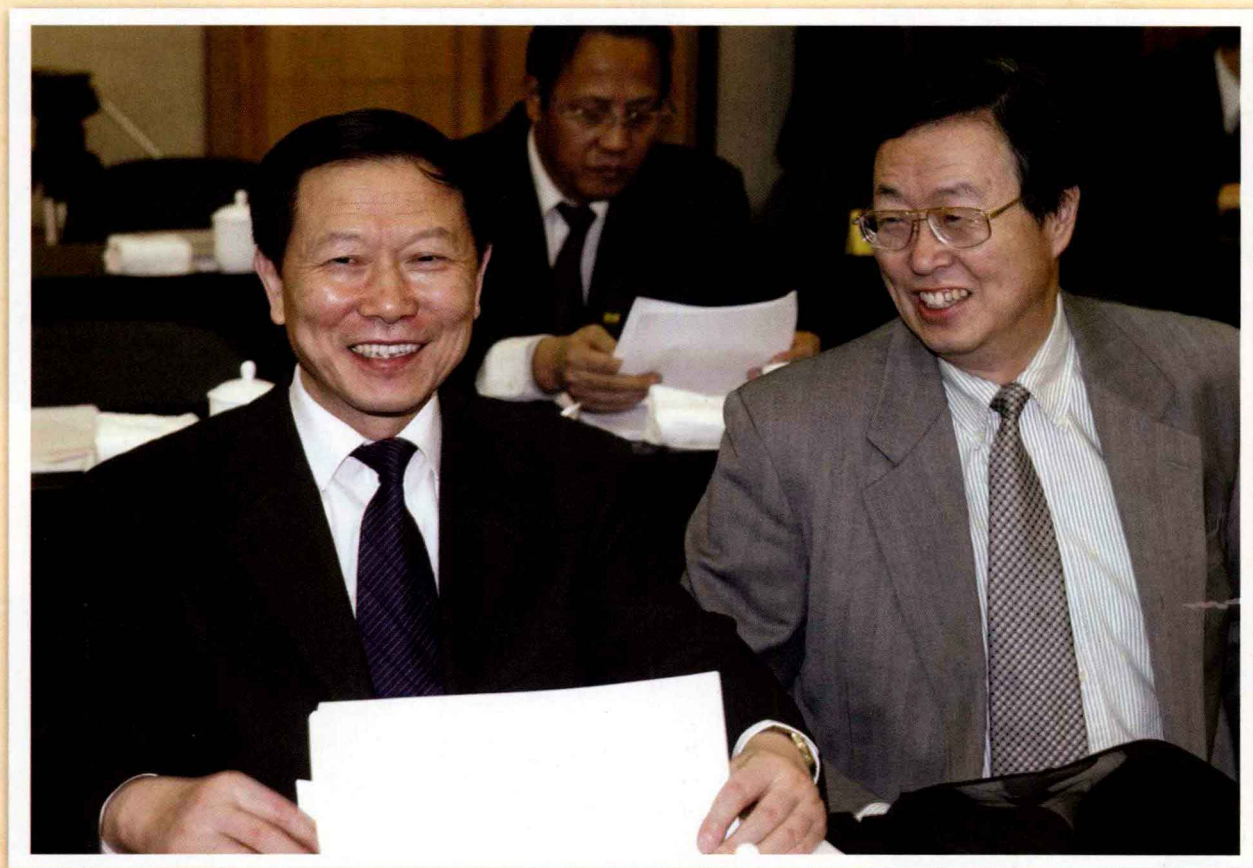
国务院国有资产监督管理委员会主任李荣融（左）、中国人民银行行长周小川（右）出席全国政协经济界、农业界委员联组讨论会。