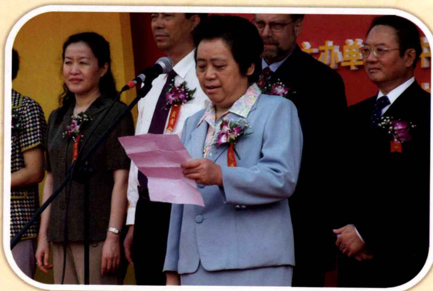
国家发展和改革委员会副主任欧新黔在中国中小企业创新发展高级 研讨会上讲话