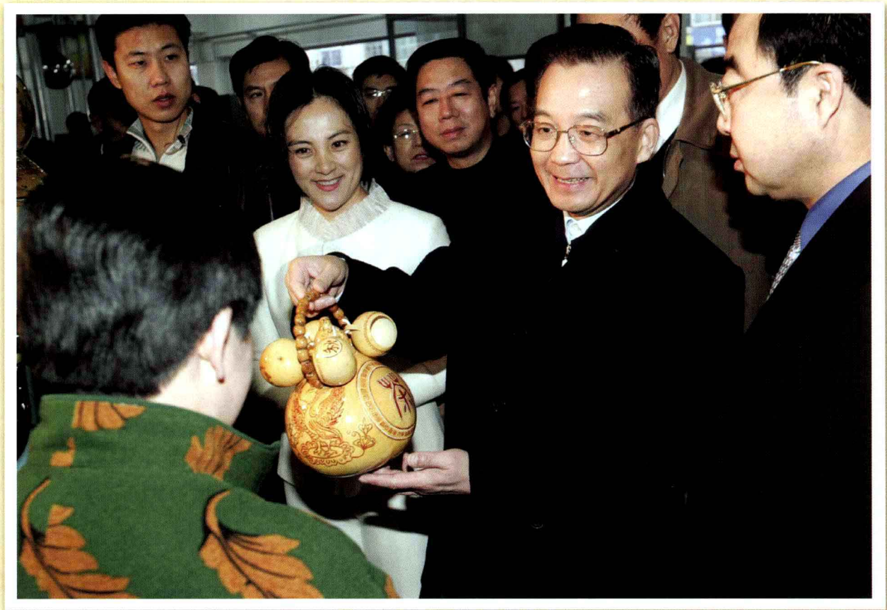
2004年11月中共中央政治局常委、国务院总理温家宝到辽宁考察，了解振兴东北等老工业基地战略实施情况。这是2004年11月14日，温家宝在锦州考察锦州市劳动力市场。