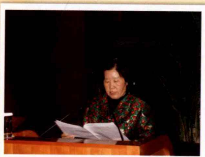
全国人大法律委员会副主任委员蒋黔 贵在全国企业管理创新大会上发言