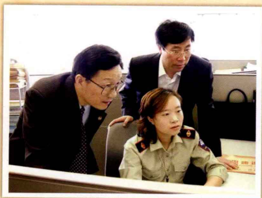
国家税务总局局长谢旭人视察苏州工业园区 国税局