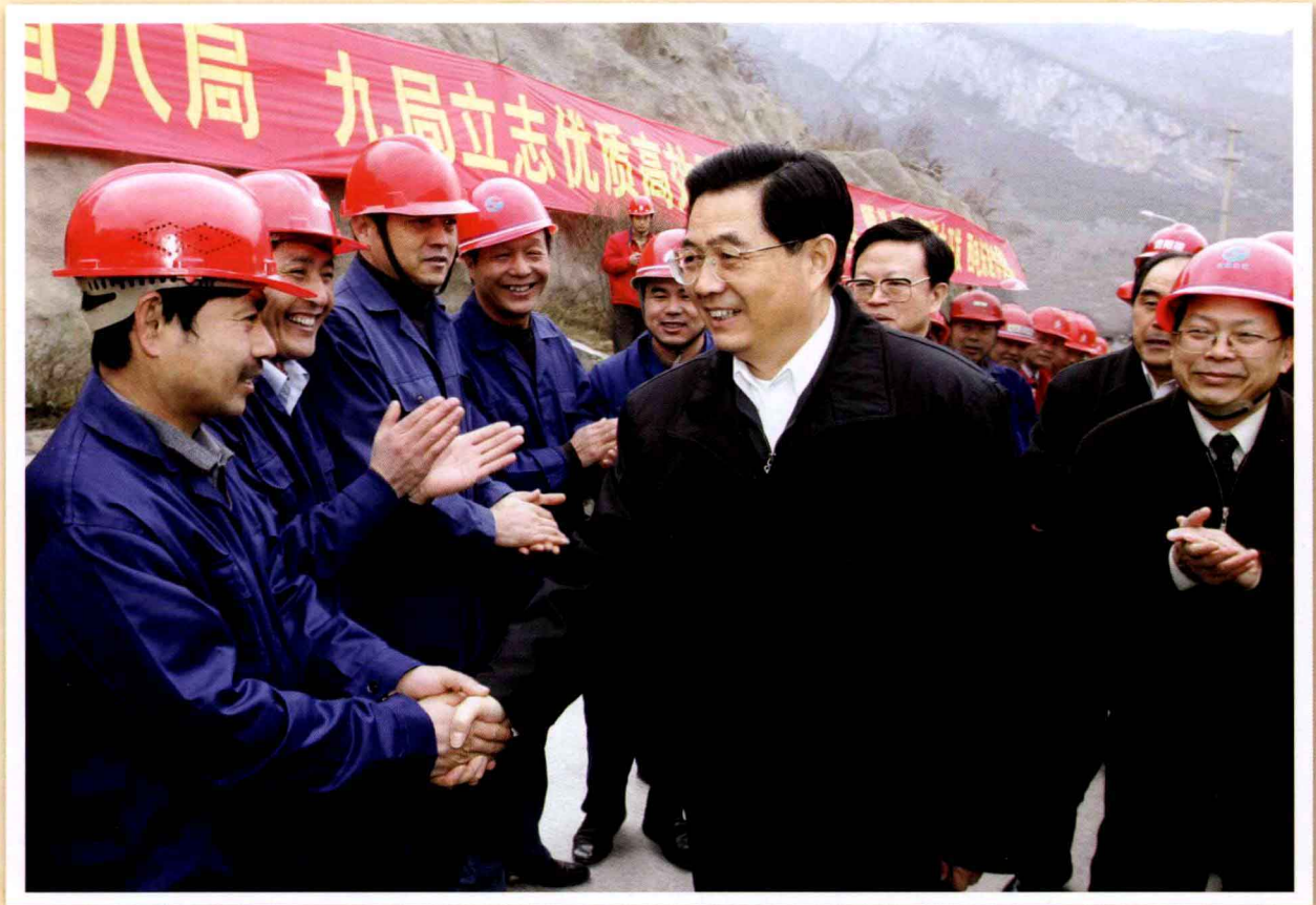
2005年2月7日至11日，中共中央总书记、国家主席、中央军委主席胡锦涛春节期间到贵州考察工作，并同各族干部群众一起欢度春节。这是2月10日胡锦涛在索风营水电站建设工地考察，并与节日加班的工人们亲切交谈。