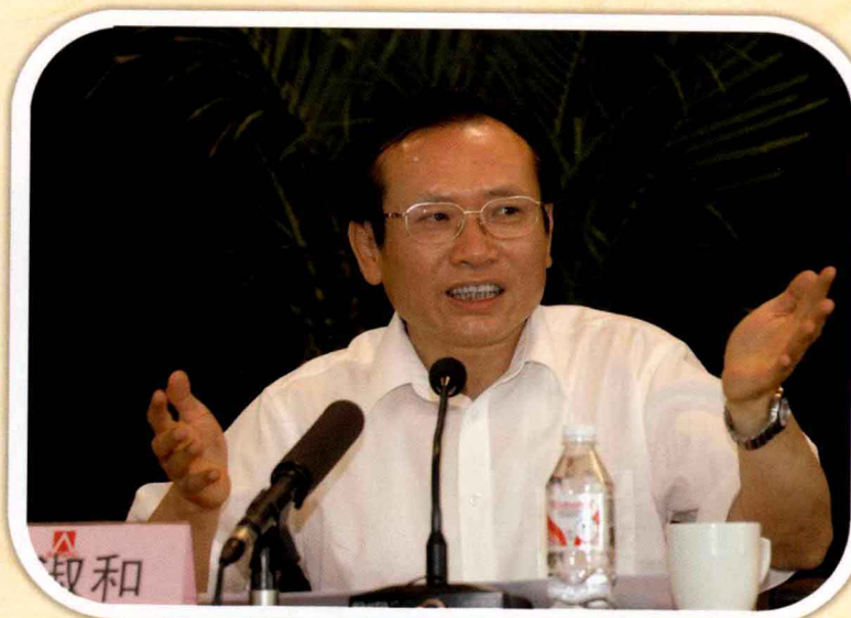
国务院国有资产监督管理委员会副主任黄淑和在地方国资委 工作会议上讲话