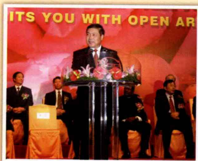
商务部副部长张志刚在第 98 届中国 出口商品交易会上致词