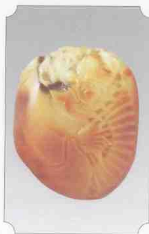
和田黄玉仔料钟馗

华夏先民用以制造旧石器的石材有石英、砂岩、安山岩、石英岩、水晶、燧石、玉髓、脉石英、玛瑙、岩浆岩、玄武岩、凝灰岩、流纹岩、闪长岩、蛇纹石、玉石、火山岩、角页岩、石灰岩、硅质岩、硅质灰岩、脉岩、细砂岩、片麻岩、花岗岩和透闪石等多种石材。这些石料被华夏先民认识、利用，对中国玉文化产生巨大的影响。