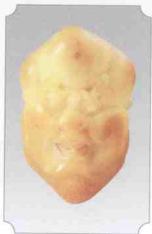
和田黄玉仔料罗汉