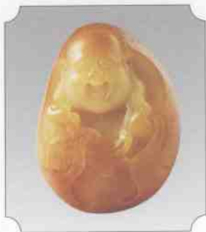
和田黄玉仔料笑佛