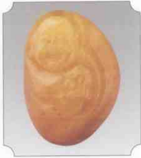
和田黄玉仔料笑佛