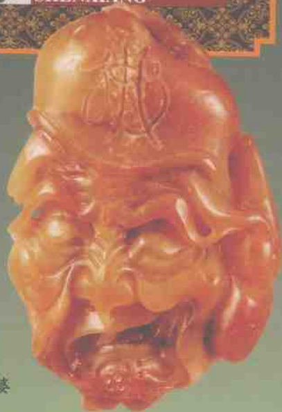
和田黄玉仔料神婆

和田黄玉非常稀少,也非常名贵。虽然和田黄玉有万年的历史,但在各个历史时期始终处在稀少和名贵的位置。和田黄玉一经出世,就和权力、地位、富贵、身份紧密联系在一起。