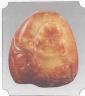
和田蟹黄玉仔料佛