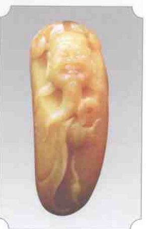
和田黄玉仔料财神