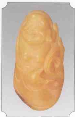
和田黄玉仔料弥勒佛