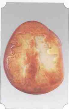
和田黄玉仔料关公