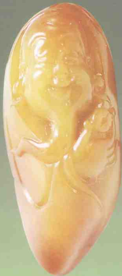
和田黄玉仔料财神

和田黄玉从古到今都是世界公认的名贵和田玉种,除了基本条件同和田玉一致外,尤其是玉质的黄色十分的高贵和雅气,不但给人以富贵的感觉,还给人以高雅的感觉;不但有华夏民族的灵气,还有中华文化的底蕴;不但中国人喜欢和田黄玉,而且外国人也非常喜欢和田黄玉。