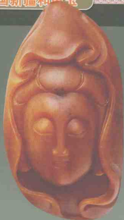
和田黄玉籽料观音

和田玉出产在昆仑山脉北坡,以和田为中心,东西走向大约 1300 公里的广大地区之内。从古到今的漫长历史时期,都有出产和田玉的历史记载,在各个历史时期的玉雕作品中,不乏和田玉作品的身影。虽说和田玉的作品比较少,但从未中断和田玉的玉雕步伐。在历史上,自从乾隆皇帝将和田玉玉雕作品垄断为皇家所有以后,民间很少见到和田玉玉雕作品。只有到了新中国成立以来,和田玉玉雕作品才走出皇宫高墙,进入普通百姓之中。和田玉玉雕作品因为稀少和名贵,所以具有很高的收藏价值。