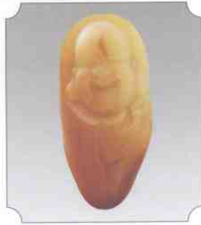
和田黄玉仔料笑佛