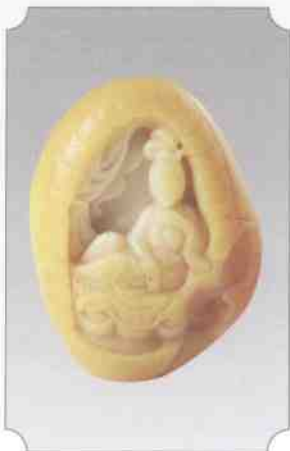
和田黄玉仔料观音