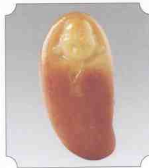
和田黄玉仔料笑佛