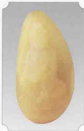
和田黄玉仔料观音

对玉的称谓，从古到今也是有变化的。古代称玉为“琅玕”，也有称“天球”、“玉英”、“宝玉”、“真玉”，并与“非真玉”区别。《山海经》记载：昆仑山有琅玕树。秦汉时期《尔雅》也记载了：西北之美者，有昆仑墟之璆琳琅玕。在尼雅遗址出土的汉代竹签，称玉为“琅玕”。