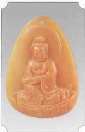
和田黄玉仔料观音