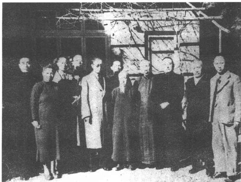
民盟与中共站在一起反对召开“国大”。左起周恩来、邓颖超、罗隆基、李维汉、张申府、章伯钧、沈钧儒、董必武、黄炎培、张君勱、王炳南。