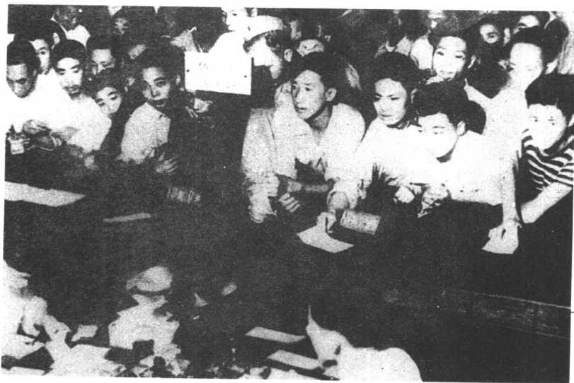
金圆券政策失败后， 中国银行上海分行的柜台 前挤兑的人潮。