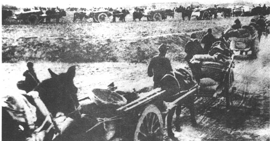
翻身农民支援解放军前线作战。