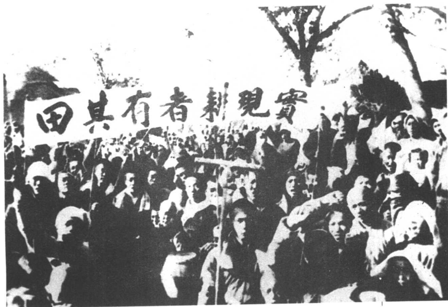
晋察冀农民拥护中共的土地改革。