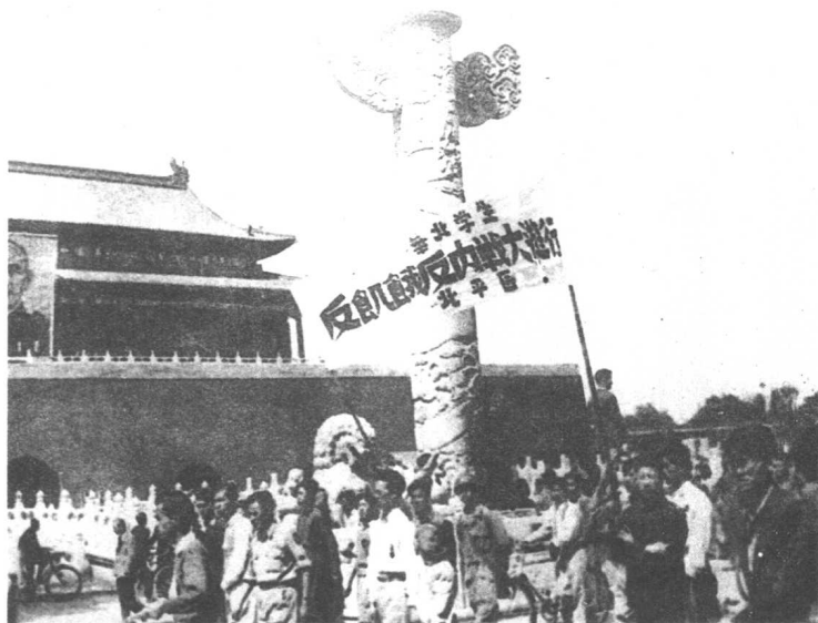
北平学生反内战反饥饿游行路过天安门。