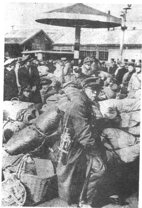
在上海火车站前等候撤走 的国民党军官，他们携带 着大量私人物品。