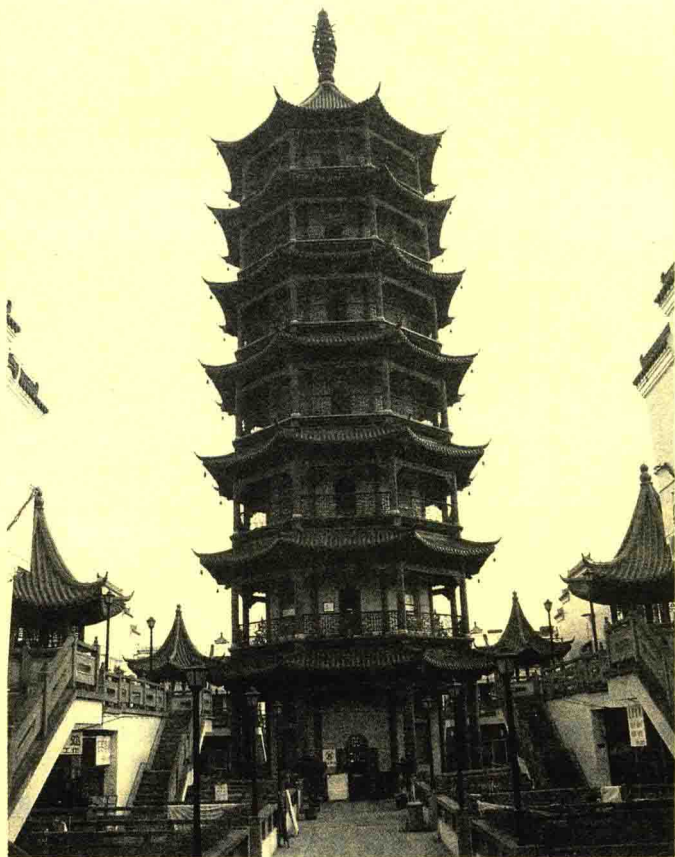
嘉善思贤塔。塔名思贤，既表对陆贄的怀念，又盼能出更多的贤士能人。