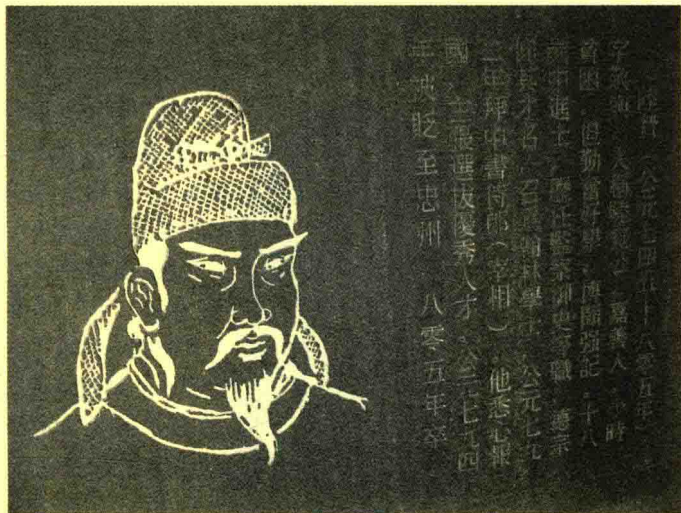
陆贄像，现存嘉善魏塘镇思贤商贸中心思贤塔内。

为之感动，斗志倍增。在陆贄的辅助下，唐德宗终于先后平定了朱泚、李怀光等的叛乱，回到了京城长安。