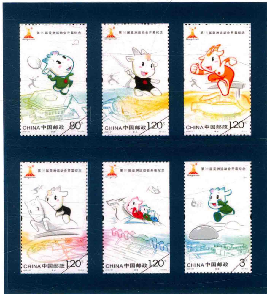
广州·第16届亚洲运动会开幕纪念邮票