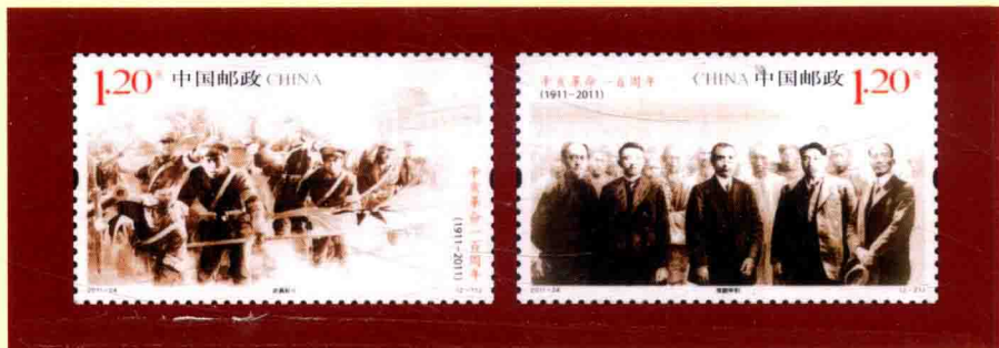
辛亥革命一百周年纪念邮票