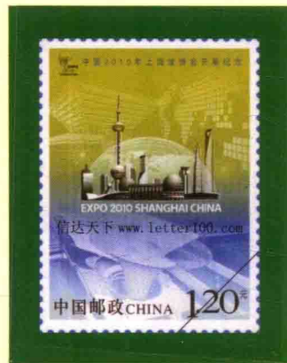
中国2010年上海世博会开幕纪念邮票

仲恺区陈江街道 党工委、办事处以“五好”为标准，全面加强领导班子建设，有效提升领导班子践行科学发展、服务科学发展、推进科学发展的能力，经济社会发展走在全市镇、街道前列。2011年获评市科学发展好班子。