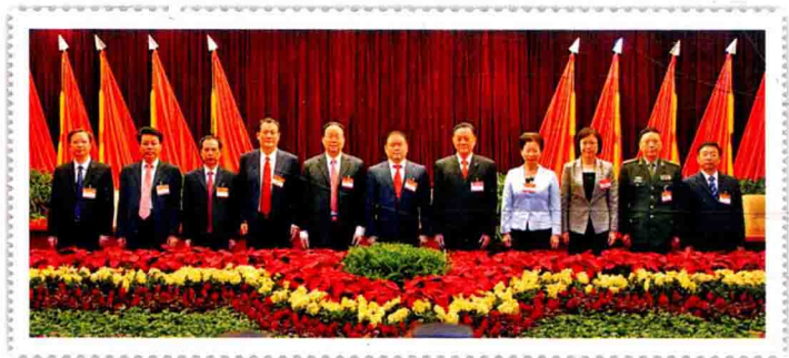
新当选的市委常委集体合影