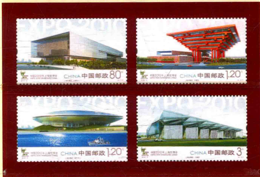
上海世博园纪念邮票