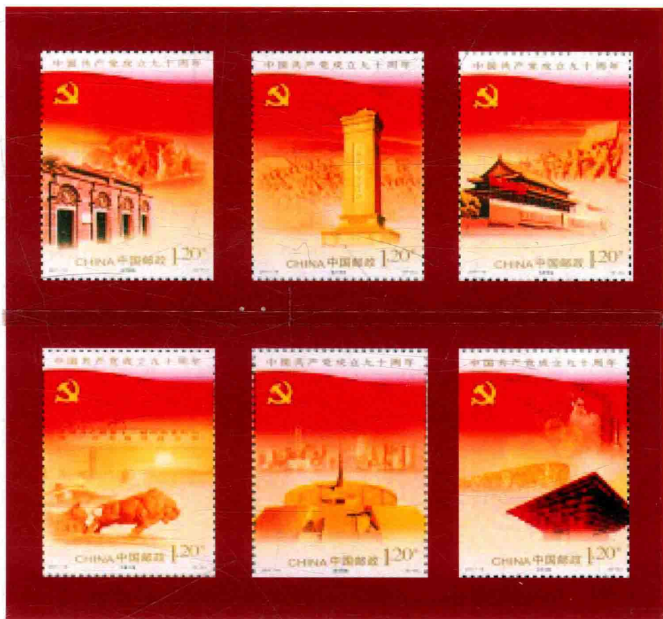
中国共产党成立九十周年纪念邮票