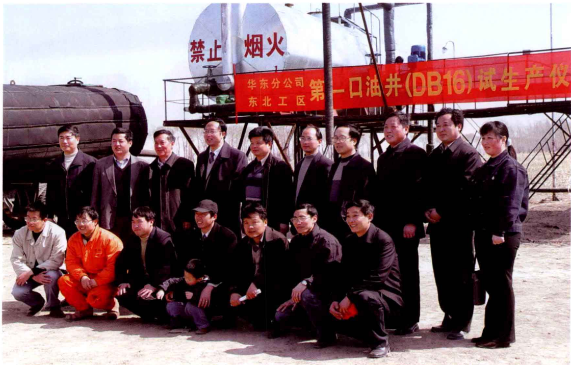
2003年3月22日，腰英台油田第一口试采井DB16井投产