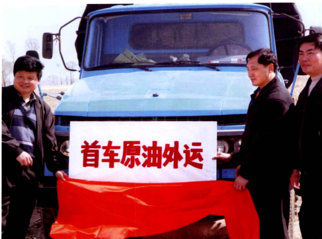
2003年3月22日，腰英台油田首车原油外运