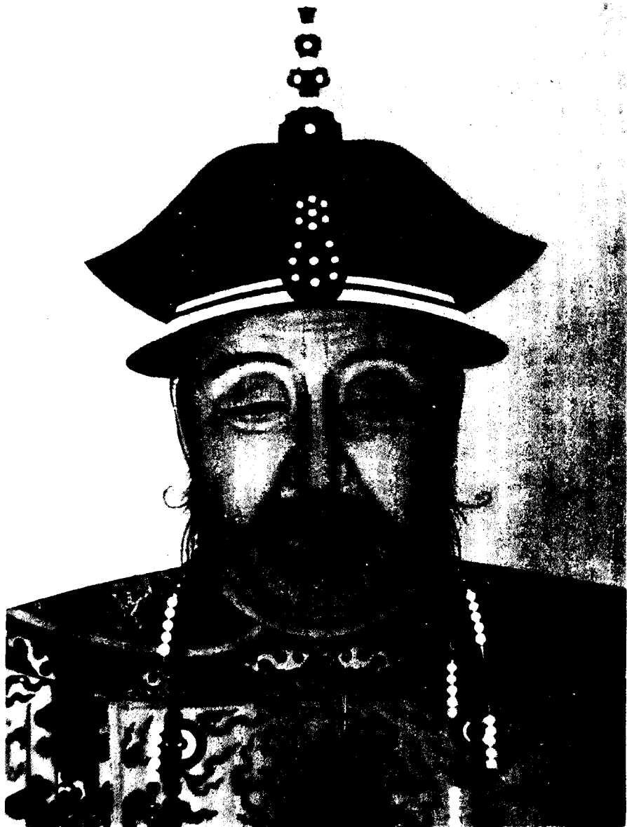
清太祖努尔哈赤像