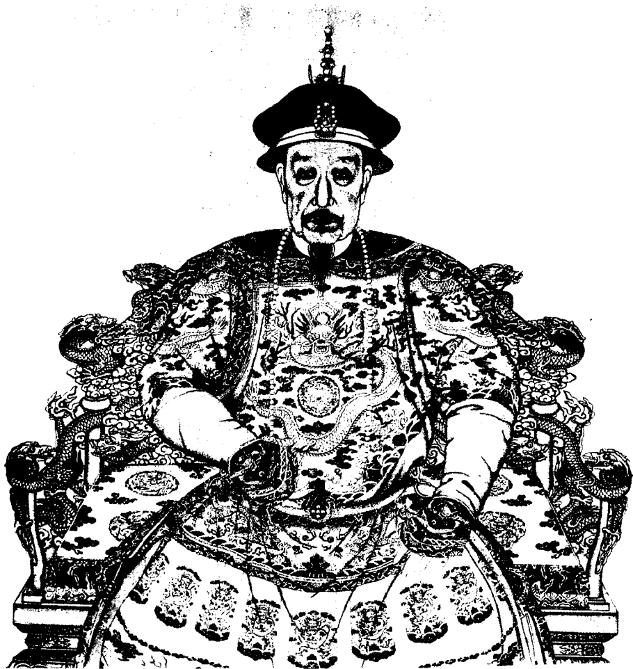
清高宗乾隆朝服像