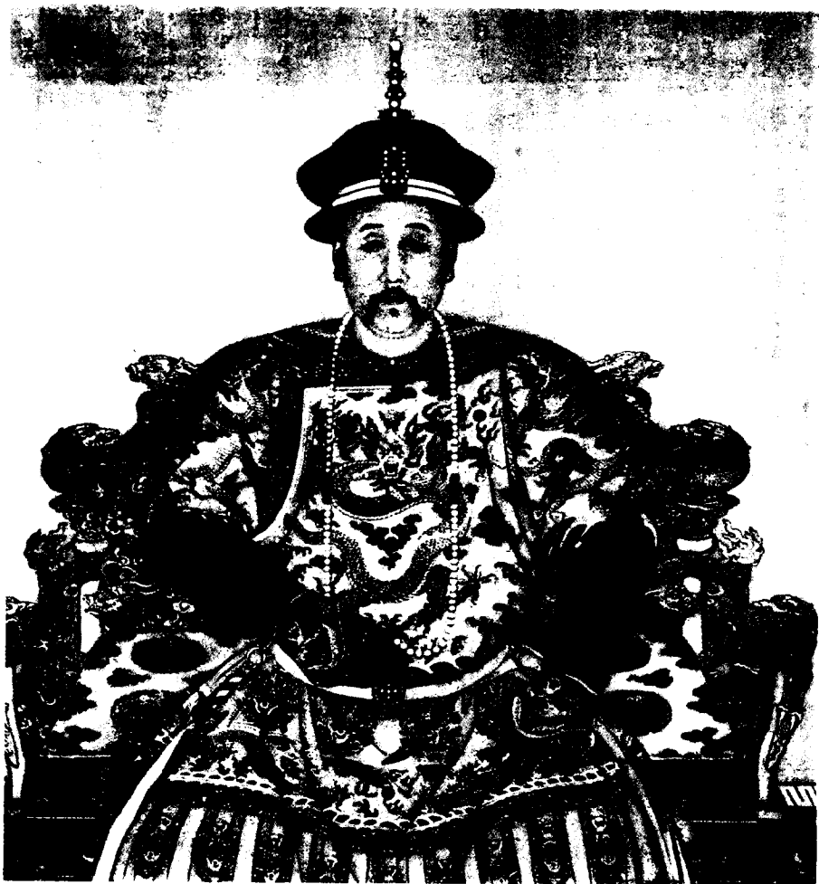
清世宗雍正朝服像