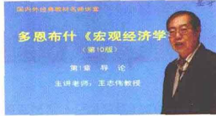
北京大学王志伟教授