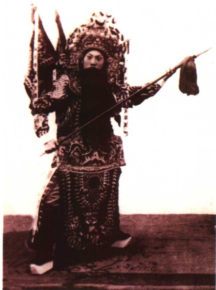
余叔岩《宁武关》中饰周遇吉