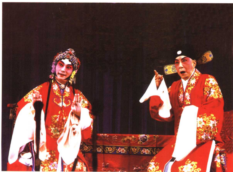
俞振飞《奇双会》中饰赵宠