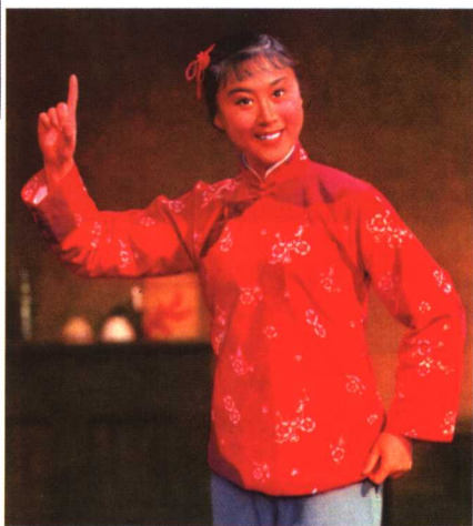
刘长瑜《红灯记》中饰李铁梅