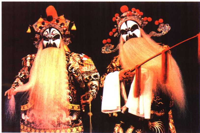
裘盛戎《姚期》中饰姚期