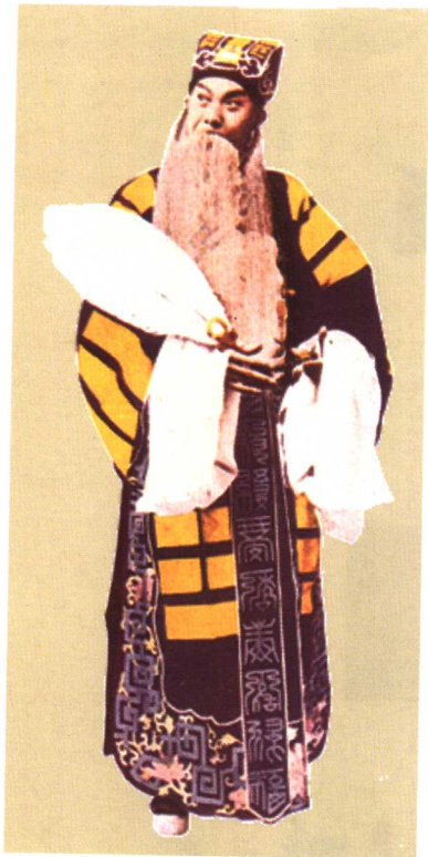
高庆奎《空城计》中饰孔明