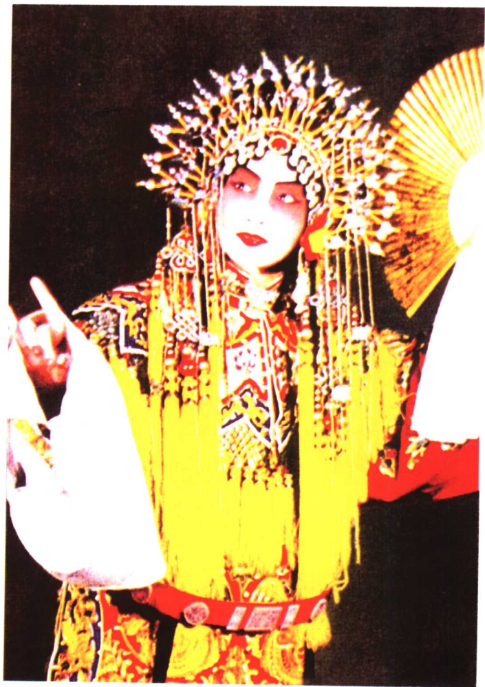
梅兰芳《贵妃醉酒》中饰杨贵妃