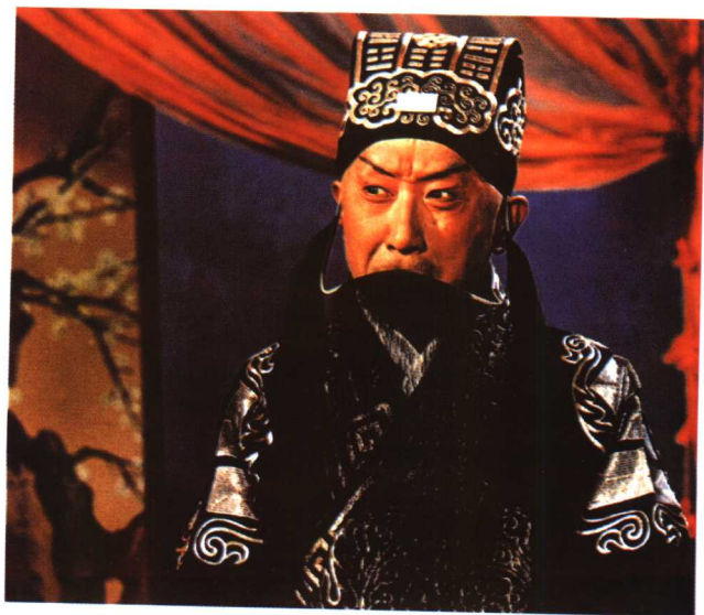
马连良《群英会》中饰诸葛亮