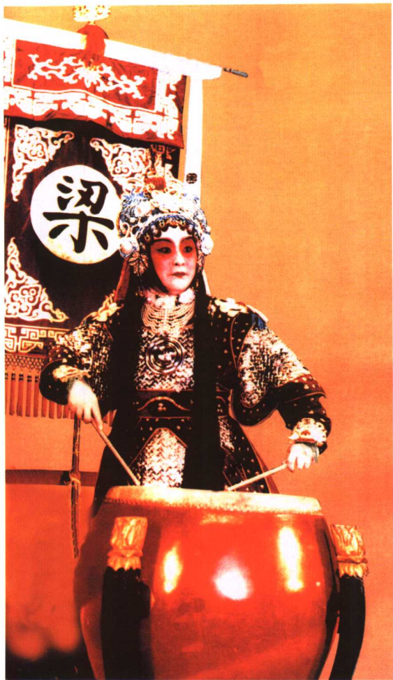
尚小云《梁红玉》中饰梁红玉