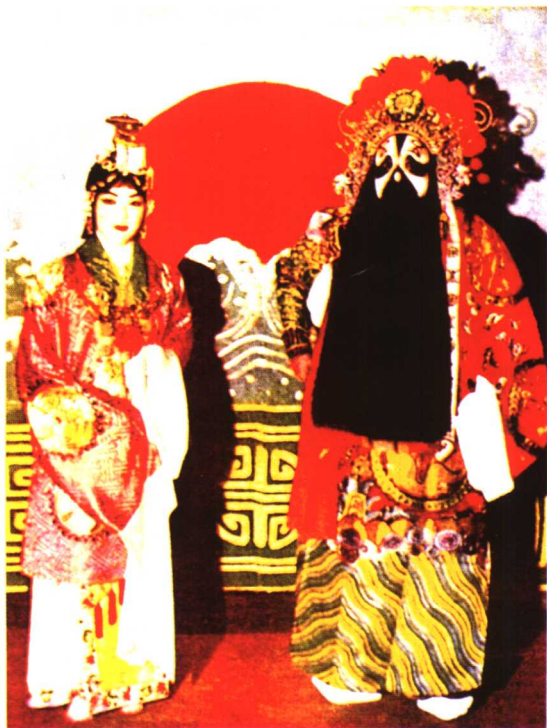
金少山《霸王别姬》中饰项羽