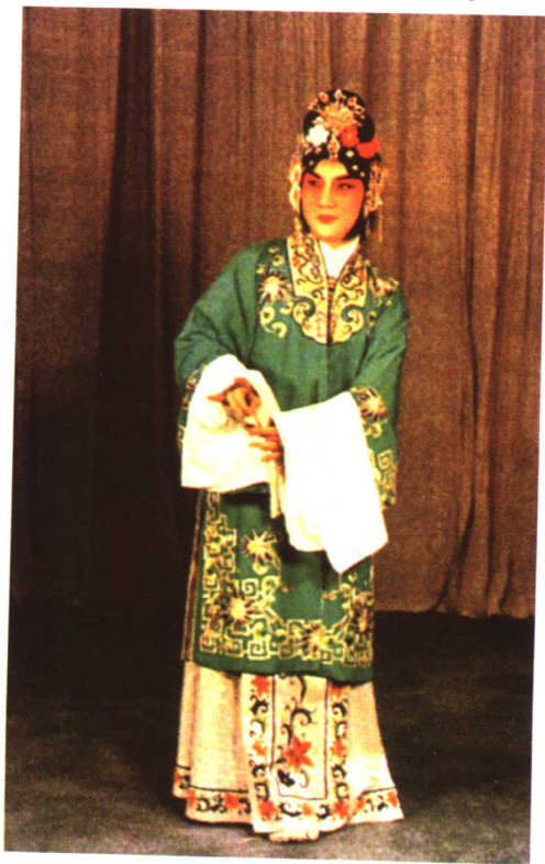
张君秋《望江亭》中饰谭记儿