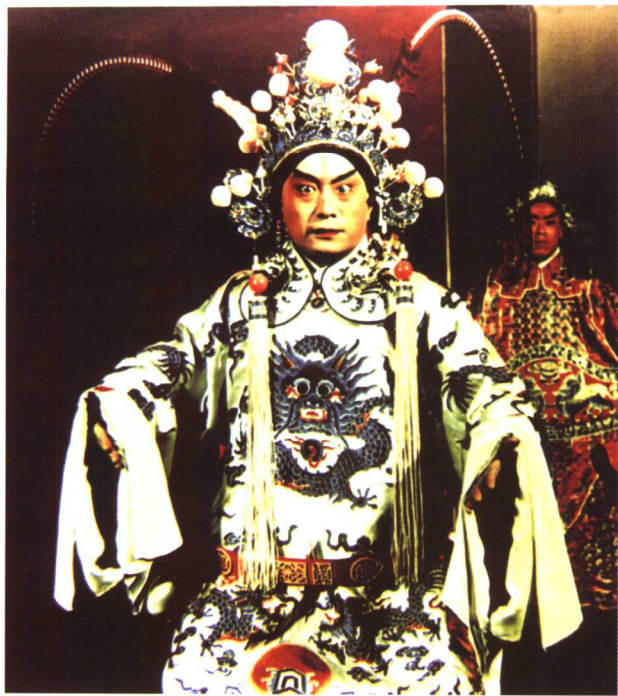
叶盛兰《群英会》中饰周瑜