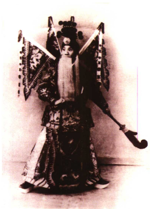
言菊朋《定军山》中饰黄忠