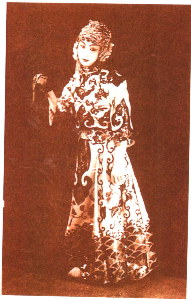
荀慧生《勘玉钏》中饰韩玉姐