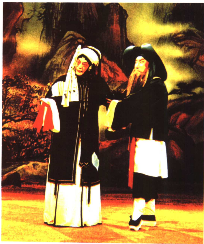
程砚秋《荒山泪》中饰张慧珠