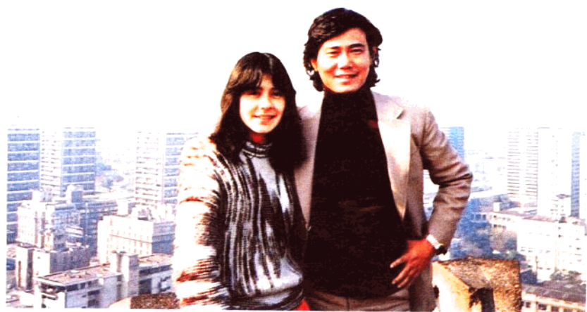
▲七毛與智利小姐合影