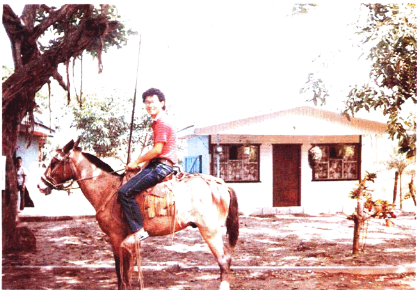
▲七毛攝於哥斯達黎加寓所前