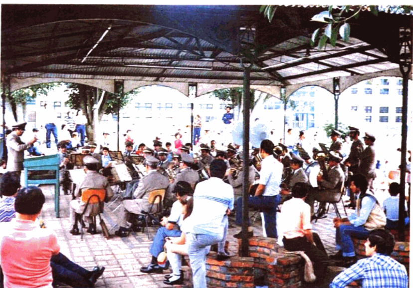
▼ 哥斯達黎加的交響樂團假日在公園演奏情形