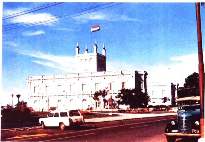
▲巴拉圭總統府掠影