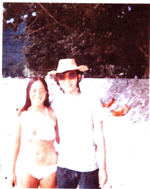
◀七毛與巴西美女合影於海灘