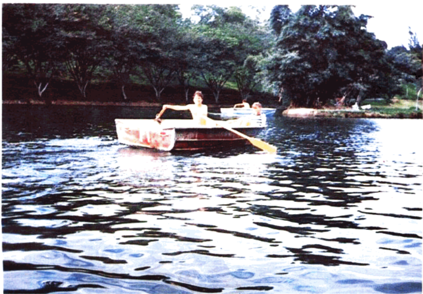
▼景色如畫的哥斯達黎加