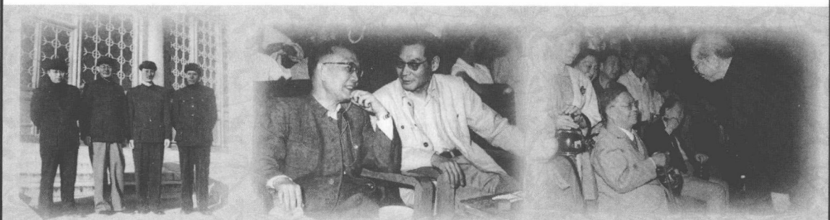
曹禺、焦菊隐、 欧阳山尊、赵起扬