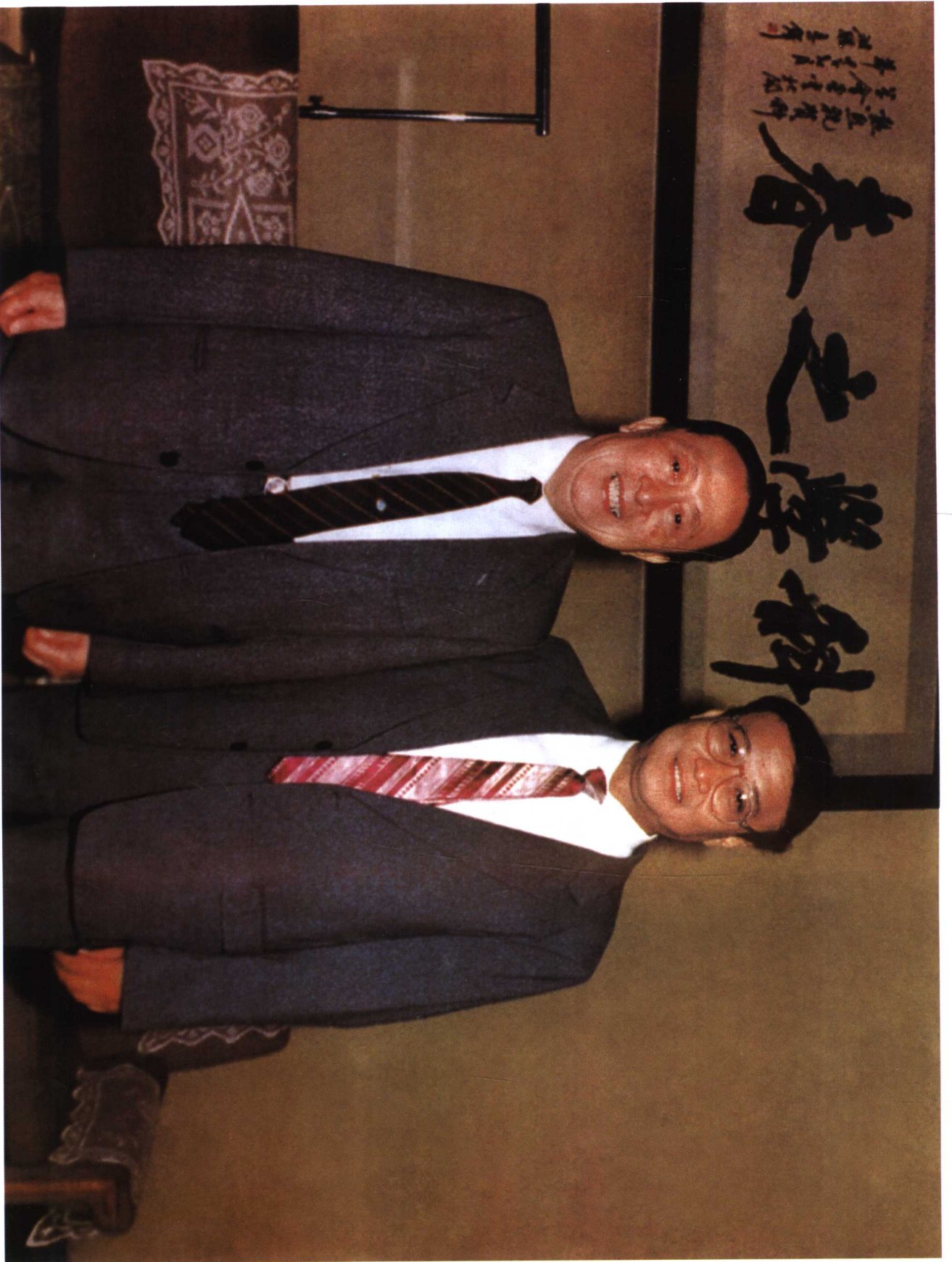
全国人大常委会副秘书长吴阶平教授，在《实用中医内科表典》首发式上亲切接见本书作者余海若医生。